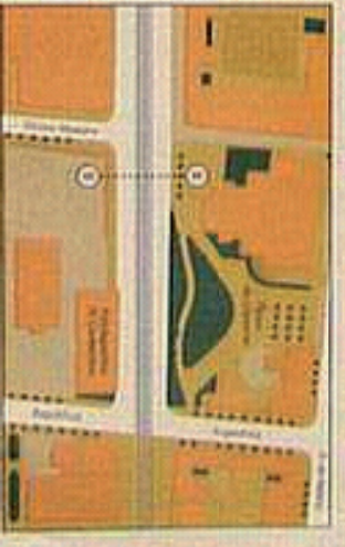
PLANTA ZONA CALLE REPUBLICA ARGENTINA