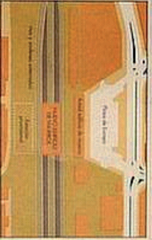
PLANTA ZONA PLAZA DE EUROPA