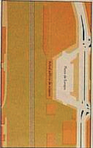
PLANTA ZONA PLAZA DE EUROPA