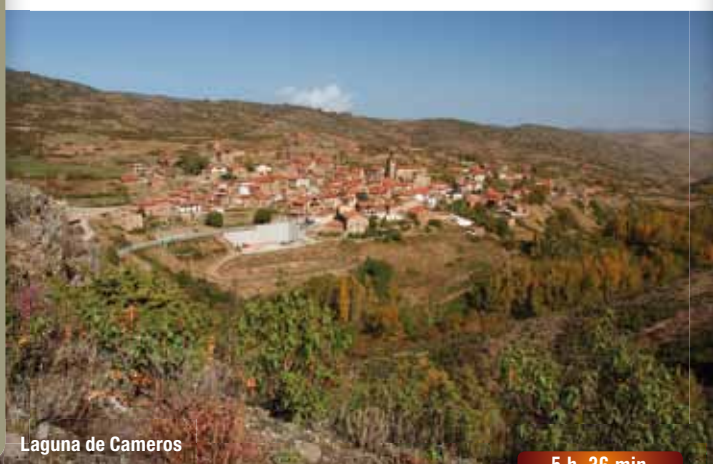
Laguna de Cameros

En el cruce de pistas tomar la principal que desciende suavemente hacia la derecha en dirección noreste. Seguir la hasta llegar al pueblo por la Ermita de Santo Domingo.