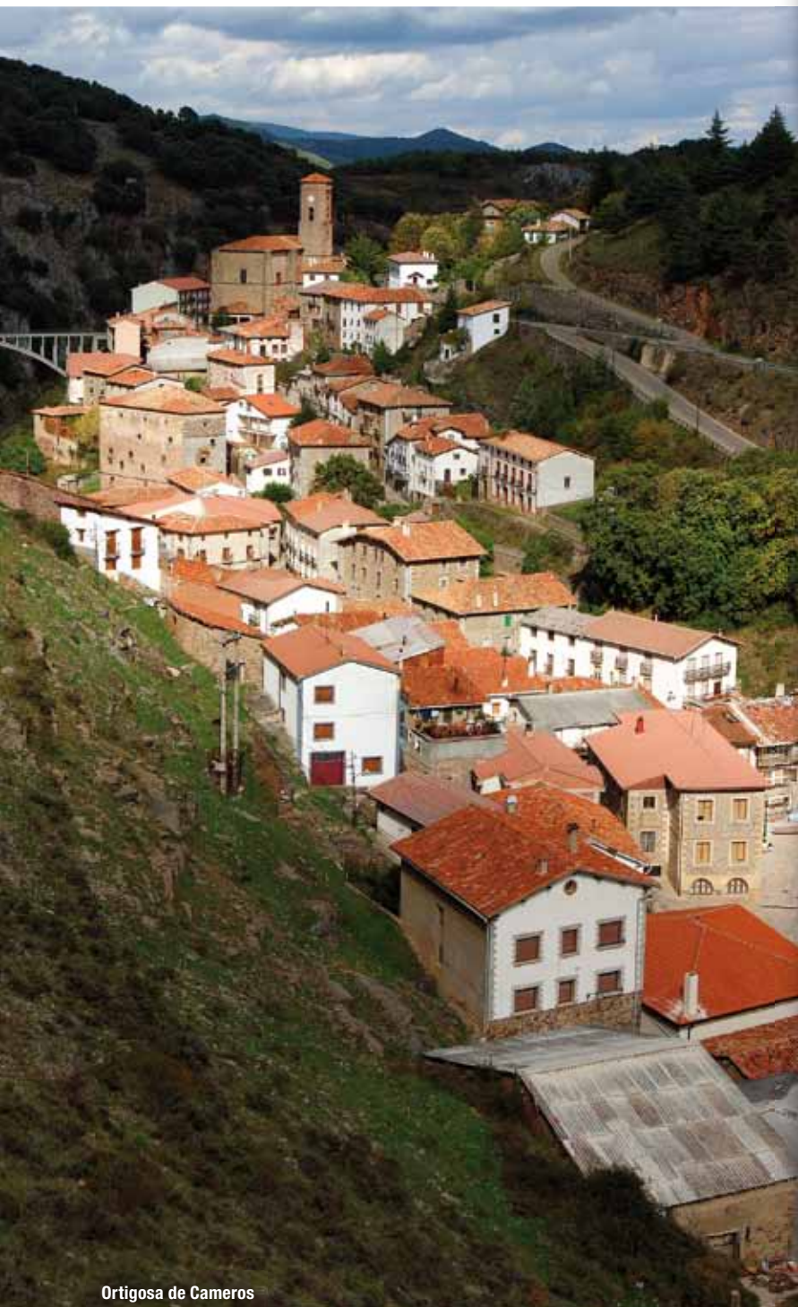
Ortigosa de Cameros