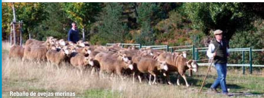
Rebaño de ovejas merinas

Las sierras riojanas de Cameros y Demanda han constituido tradicionalmente un espacio de aprovechamiento temporal de los pastos de altura mediante el sistema de la trashumancia o trashumo. Grandes rebaños de ovejas de raza merina ocupaban durante el verano los puertos y collados con pastos estivales jugosos y eran transportados a las regiones de Extremadura, La Mancha y Andalucía, en donde aprovechaban los pastos bajos durante el resto del año.