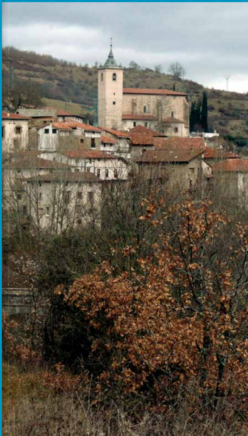
Villanueva de Cameros