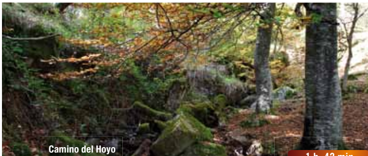
Camino del Hoyo