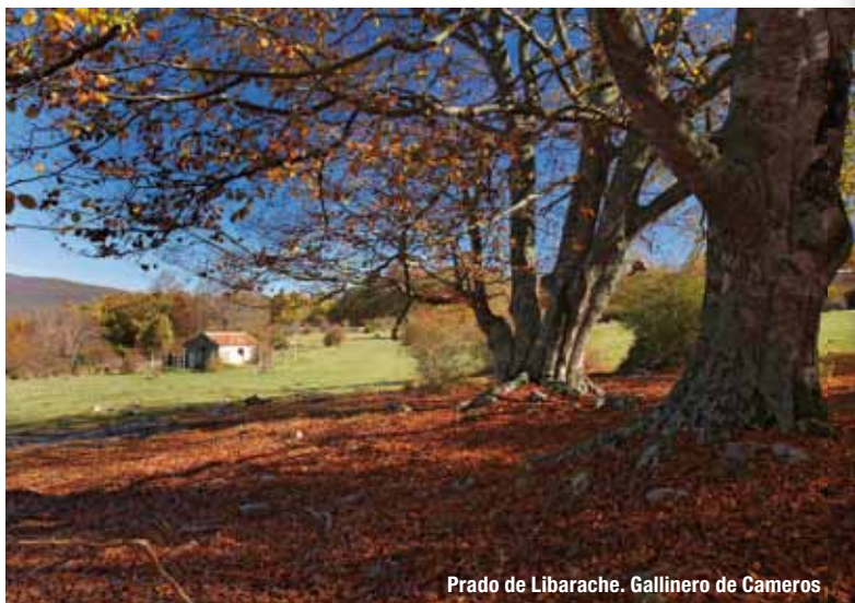
Prado de Libarache. Gallinero de Cameros

Ortigosa de Cameros ...20,5 km...Laguna de Cameros