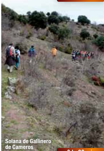
Solana de Gallinero de Cameros

En un alto se observa la Ermita de la Virgen de La Cuesta. Atravesar el pueblo por la calle Real, que pasa bajo la iglesia. A la salida, tras vadear un arroyo ascender en dirección noreste por el antiguo camino a Pinillos durante 400 m. Mediante giro cerrado, tomar senda a la derecha que en dirección suroeste asciende hacia un collado.