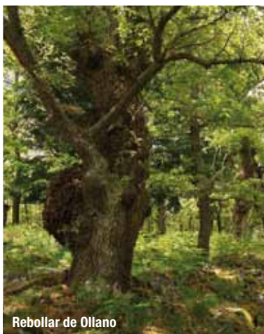
Rebollar de Ollano

En La Rioja forma bosques en las zonas con clima de transición entre las áreas más húmedas, cubiertas de hayedos, y las más secas caracterizadas por los encinares. Son bosques densos, casi impenetrables, con numerosos pies rebrotados de cepa o raíz, enclavados sobre terrenos silíceos, especialmente cuarzarenitas, esquistos o conglomerados sueltos y lavados. Su zona de distribución potencial comprende la mayor parte de la Sierra, en una banda entre los 700 y los 1.400 m. de altitud cuyos límites exactos dependen de la orientación y la humedad.