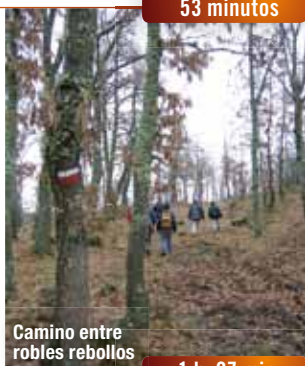
Camino entre robles rebollos

Pasar junto a la caseta y seguir subiendo entre un bosque de rebollos. A los 25 minutos, tras abandonar el bosque, se pasa junto a una caseta de aguas en medio de un prado. Seguir en la misma dirección y a los pocos metros cruzar una pista, pasar una portilla y ascender por un cortafuegos entre pinares.