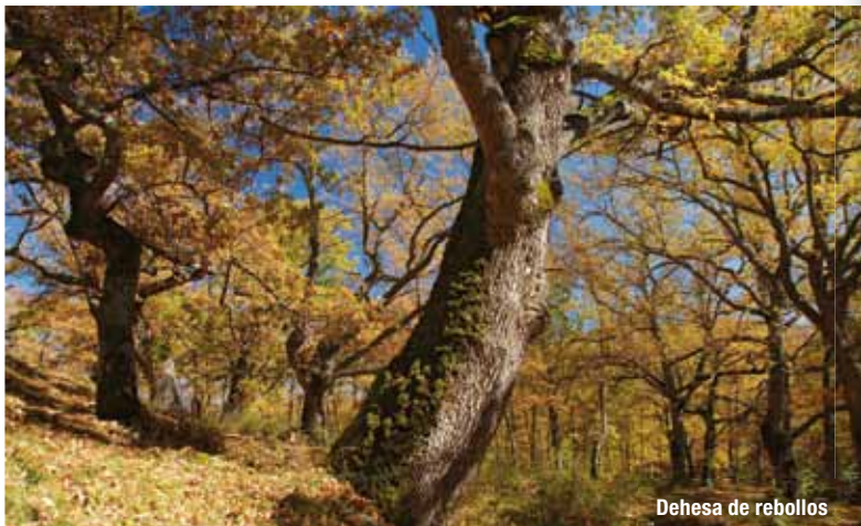
Dehesa de rebollos

El rebollo es un roble de porte medio que puede alcanzar 25 m. de altura, reconocible por sus hojas profundamente lobuladas, muy aterciopeladas por ambas caras y que perduran secas en el árbol la mayor parte del invierno.