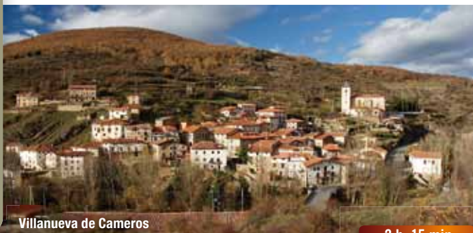
Villanueva de Cameros

Villa situada a orillas del río Iregua con interesante retablo en la Iglesia de San Martín y nogal centenario junto a la Ermita de N a Sra. de los Nogales. Salir del pueblo por el camino que parte de la carretera general a la altura del Consultorio de Salud. Tras ascender 30 m. girar hacia la izquierda por una pista que bordea la trasera de las casas. A la altura de la Ermita se transforma en sendero y la pendiente se acentúa hasta alcanzar una alambrada.