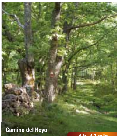
Camino del Hoyo

Enlace del sendero que se dirige por la izquierda a Villoslada, distante 5,6 Km. Continuar entre muros hacia la derecha. A los 5 minutos se llega a una pista que se sigue durante 40 m. a la derecha para a la altura de un bloque de piedra tomar sendero a la izquierda en dirección noroeste. Tras una zona de bosque se atraviesan unos claros con prados manteniendo la dirección noroeste y se desciende suavemente hasta llegar a una alambrada.