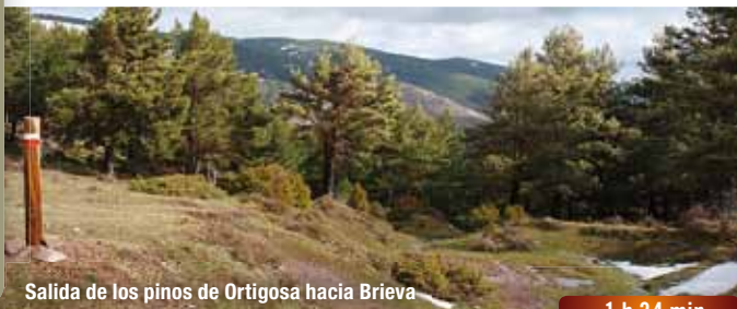
Salida de los pinares de Ortiguosa hacia Brieva

Justo después del abrevadero se abandona la trocha hacia la izquierda y, atravesando unos pastos en dirección suroeste, se continúa el ascenso por un camino bien marcado entre pinares, hasta llegar a un collado con una alambrada.