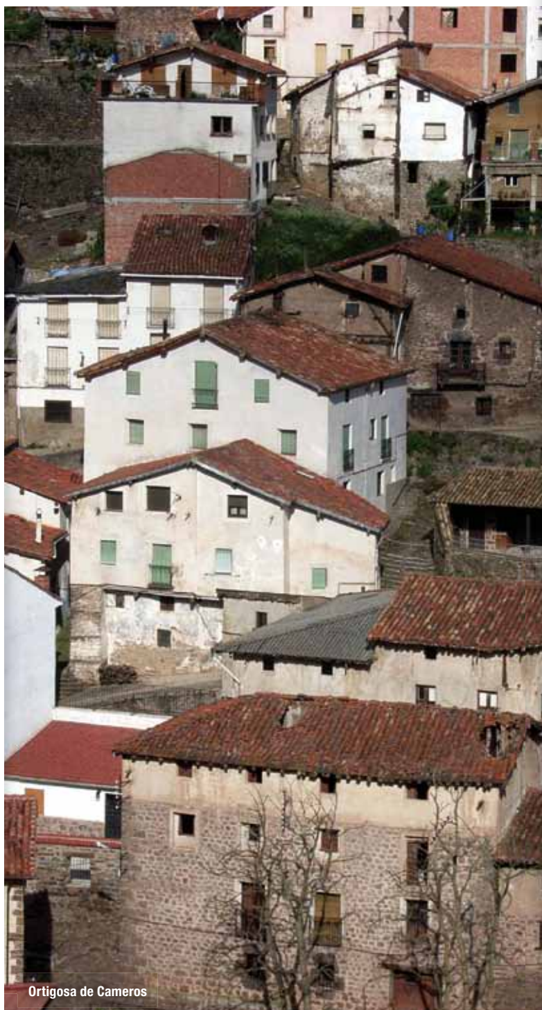
Ortigosa de Cameros