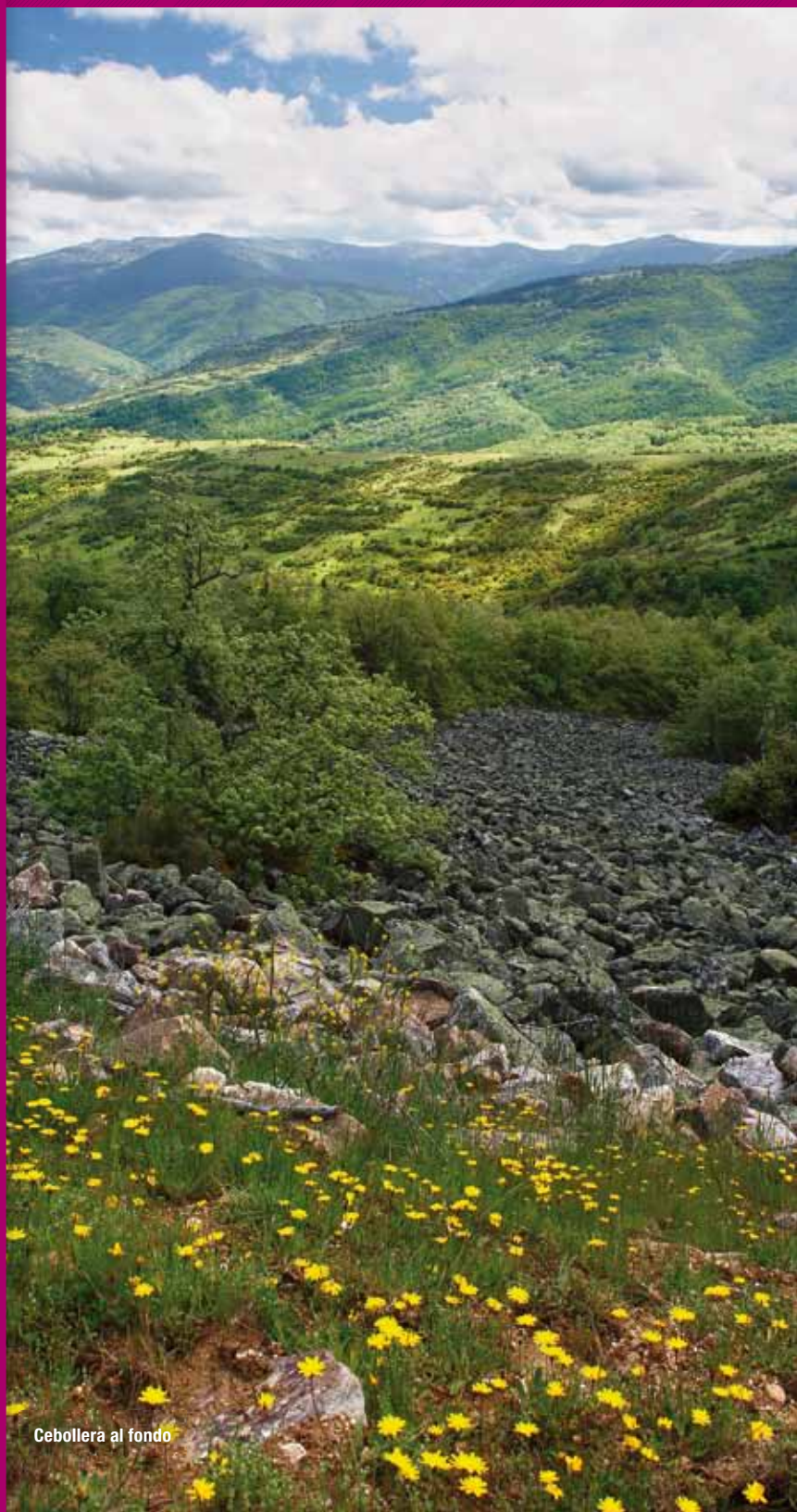
Cebollera al fondo