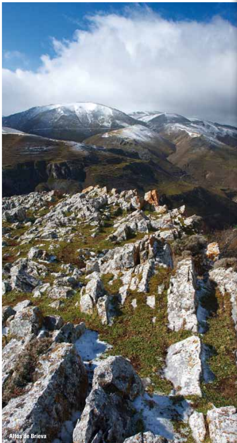
Altos de Brieva