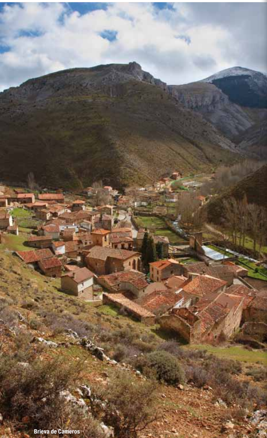
Brieva de Cameros