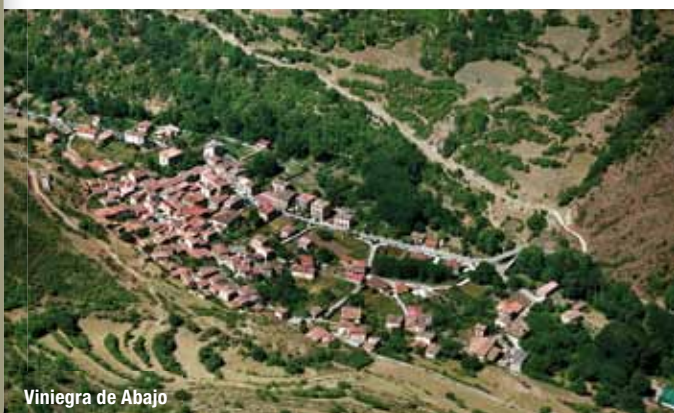
Viniegra de Abajo

En la misma Venta se abandona la carretera comarcal para tomar por la izquierda, una vez pasado el puente sobre el río Najerilla, la carretera local a Viniegra de Abajo y Ventrosa. Continuar por la carretera, dejando más tarde a la izquierda el empalme a Ventrosa, y llegar, sin pérdida, a Viniegra de Abajo.