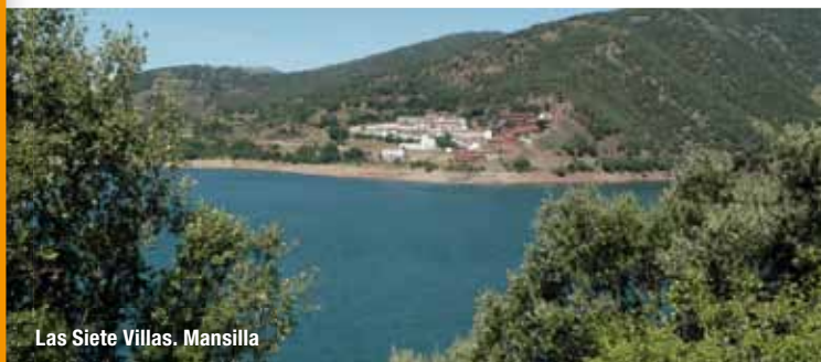
Las Siete Villas. Mansilla

Algunos aspectos destacados de los diferentes municipios son: en Brieva de Cameros, el Museo del esquileo y el monte Cabezo del Santo; en Ventrosa, el puente de la hiedra que se encuentra en la carretera comarcal poco antes de la Venta de Goyo; en Canales de la Sierra, el papamoscas de la torre del reloj, la ermita románica de San Cristobal y el paraje de la ermita de la Soledad; en Mansilla de la Sierra, la ermita románica de Santa Catalina, un buen lugar para ver las antiguas casas que quedan al descubierto cuando baja el nivel de agua del embalse y los restos de las más de cuarenta minas que llegaron a explotarse; en Viniegra de Abajo, la huella de los indianos que ha quedado impresa en las casas palaciegas y el valle del río Urbión y sus lagunas glaciares; en Viniegra de Arriba, su bien conservada arquitectura popular y la tradición trashumante que aún se mantiene por algunos de sus ganaderos; y en Villavelayo el valle del río Neila y la Ermita de Santa Áurea, única santa nacida en La Rioja y cuya biografía narró en verso Gonzalo de Berceo.