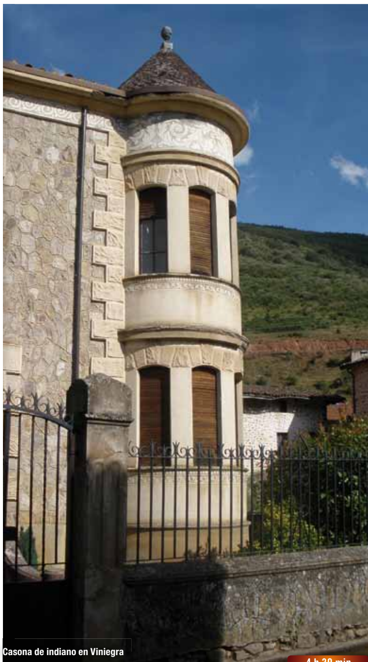
Casona de indiano en Viniegra