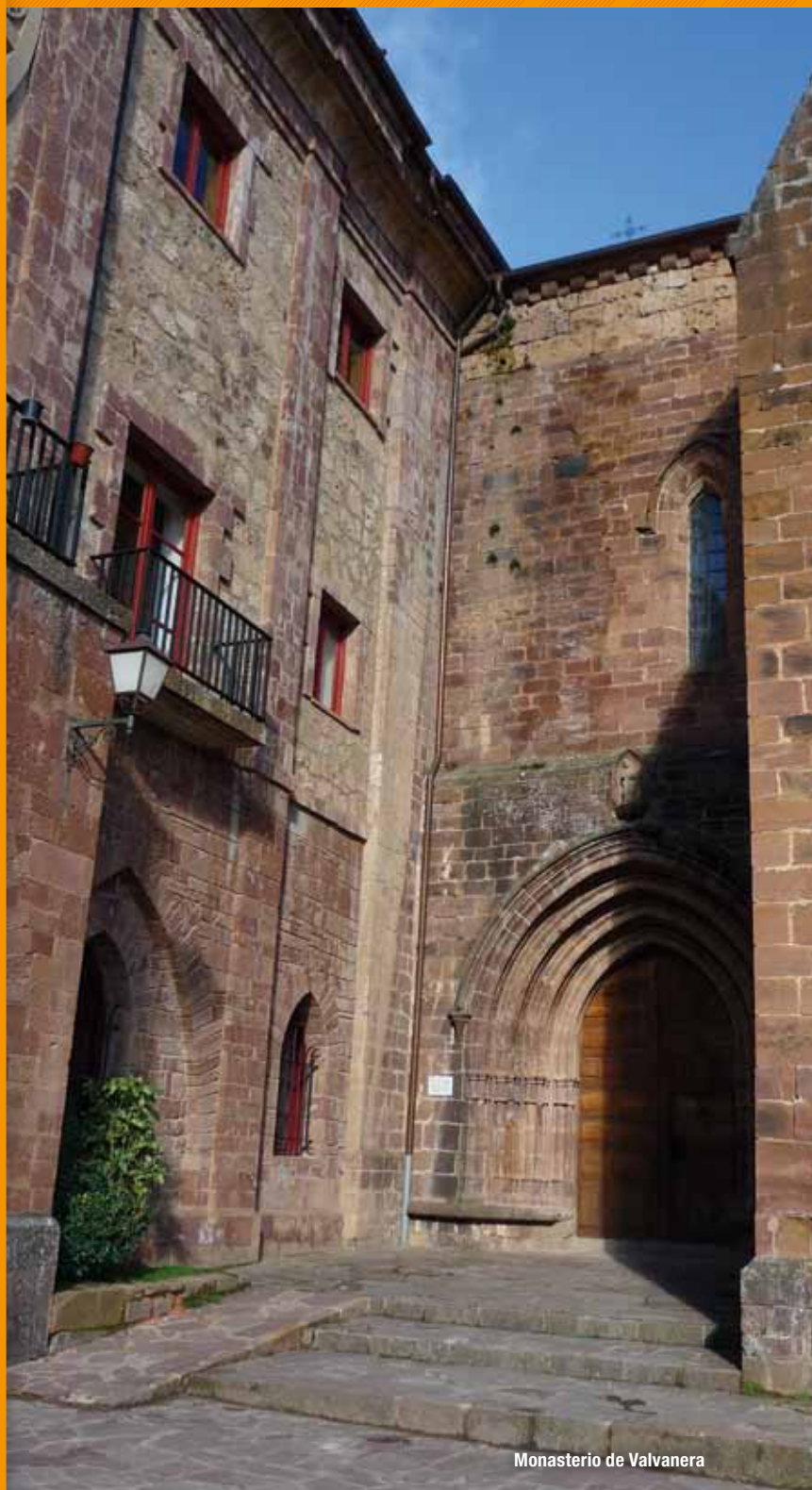
Monasterio de Valvanera