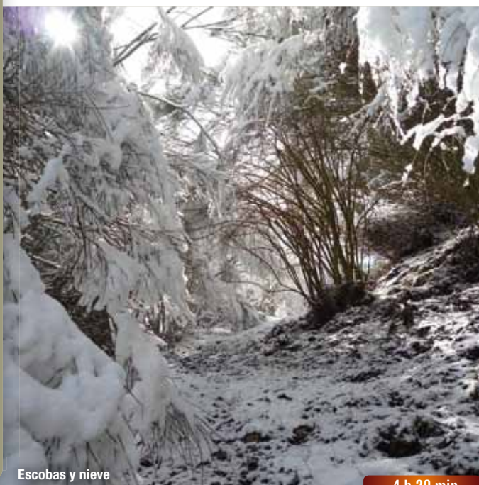
Escobas y nieve

En la pista girar a la izquierda y continuar, ya fuera del pinar, el descenso. A unos 30 m de una curva muy pronunciada, se abandona la pista por la izquierda para tomar un camino que baja directamente al Monasterio.