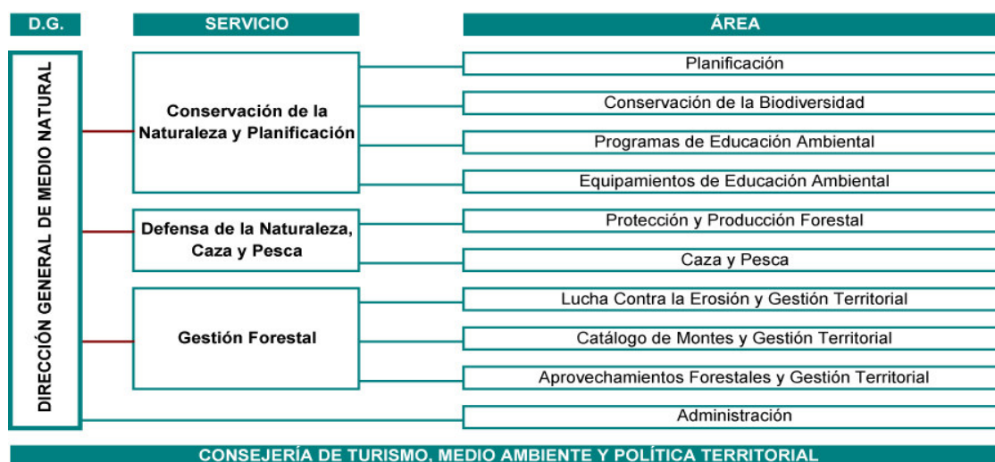
Fig.1.- Organigrama de la Dirección General de Medio Natural

A continuación se presenta el organigrama de la Dirección General de Medio Natural: