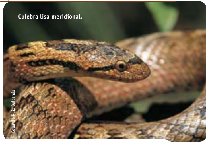
Culebra lisa meridional.