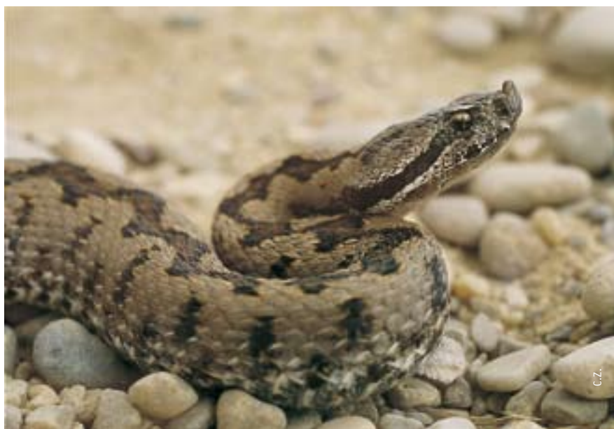
En nuestra región la víbora hocicuda es menos abundante que la víbora áspid.

El saber popular tiene en la cabeza triangular y el dibujo dorsal en zigzag