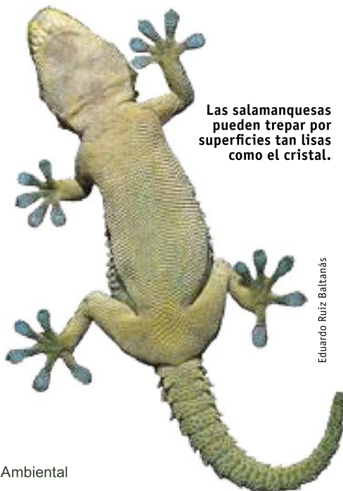
Las salamanquesas pueden trepar por superficies tan lisas como el cristal.

Las otras tres lagartijas presentes en La Rioja ocupan territorios bastante diferentes a los de lagartija roquera, son de corte mediterráneo y muy poca gente las distingue (ni siquiera los pastores, grandes observadores, a los que he preguntado en muchas ocasiones sin obtener respuesta positiva).