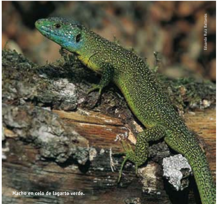
Macho en celo de lagarto verde.

Una lagartija muy parecida a la ibérica es la lagartija roquera . Su nombre no debe hacernos pensar que estamos ante una ferviente seguidora de la música moderna, sino más bien ante una moradora de las rocas y taludes (a veces también de construcciones humanas) de nuestras sierras más altas, frías y húmedas de la mitad oeste del Sistema Ibérico, de Toloño o de los Montes Obarenes. Es por tanto, una especie de corte centroeuropeo presente desde Turquía hasta el Sistema Central español, y por ello, en La Rioja no la deben buscar muy lejos