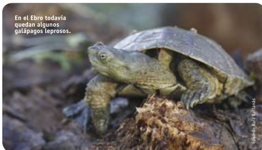
En el Ebro todavía quedan algunos galápagos leprosos.