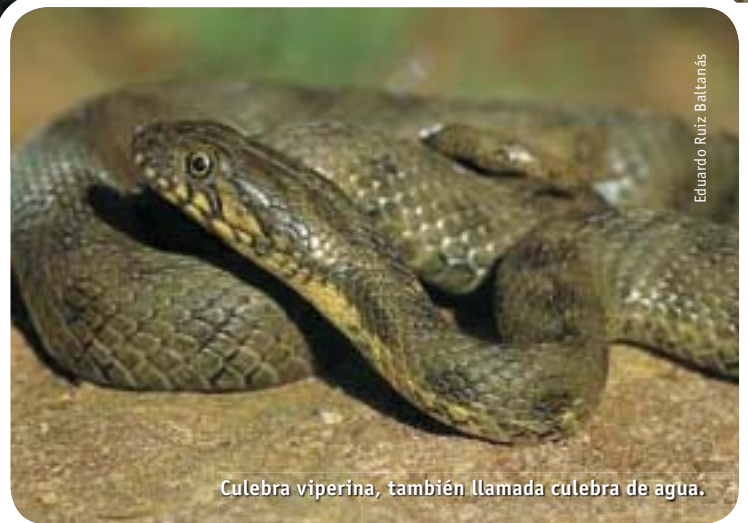
Culebra viperina, también llamada culebra de agua.

la receta para distinguir entre víboras y culebras. Pero estos dos caracteres no son tan infalibles como la gente cree, porque hay víboras que nacen sin un claro dibujo en zigzag, y hay culebras que imitan a las víboras tanto en el diseño dorsal como en la cabeza triangular. Al margen de otras diferencias, si un profano quiere distinguir entre víbora y culebra lo mejor es que observe su cabeza: y si la pupila del ojo es vertical como la de un gato, el dorso de la cabeza está cubierto por muchas escamas pequeñas y el hociquillo lo tiene levantado (nariz respingona) estará ante una víbora; pero si la pupila es redonda, la cabeza está recubierta por grandes escamas dorsales y el hocico es romo, lo que está viendo es una culebra. Aún así, el mejor consejo que podemos dar a todo el que se encuentre con un ofidio es que lo deje escapar para que siga desarrollando su encomiable labor rodenticida e insecticida, por mucho que bufe e intimide el siempre asustado animal. Y si tenemos la mala suerte de ser mordidos por alguna víbora, tranquilicémonos y no hagamos caso del saber popular con succiones bucales y asfixiantes torniquetes, que tenemos tiempo de llegar al hospital más cercano para que nos atiendan convenientemente los profesionales.