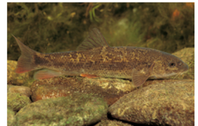
Barbo colirrojo ( Barbus haasi ). F.J. y J.V. Nalda