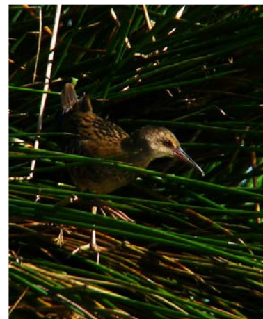
Rascón ( Rallus acuaticus ). I. Gámez