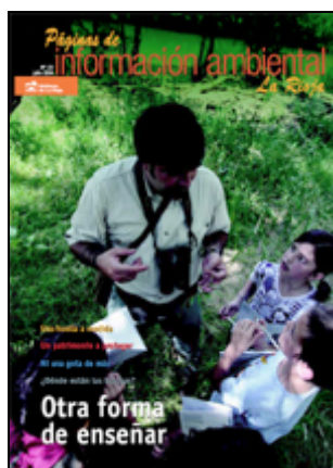
Figura 9.15. Portada de la revista Páginas de Información Ambiental La Rioja nº 23, de julio de 2006, en la que se incluía la Consulta sobre los Paisajes Sobresalientes y Singulares de La Rioja.

En su formato en papel, la Consulta fue incluida en el número 23, de julio de 2006, de la revista gratuita Páginas de Información Ambiental La Rioja , editada por el Gobierno de La Rioja. (Figura 9.15)