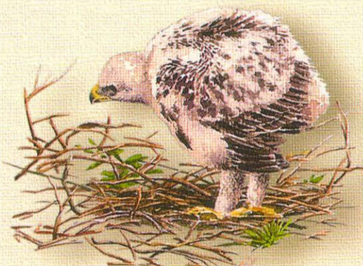
Pollo de 1 mes