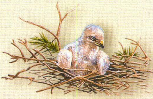
Pollo de días