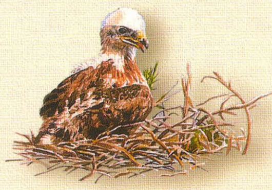
Pollo plumándose (casi voladero)