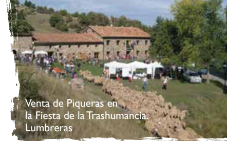
Venta de Piqueras en la Fiesta de la Trashumancia. Lumbreras

En la zona se pueden saborear todos los manjares de la buena cocina riojana y en especial de la recia y sencilla cocina camerana, que combina el sabor de antaño con finos toques actuales.