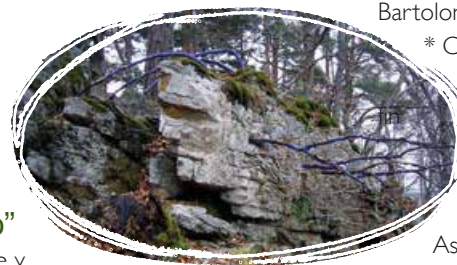
Ermita de Lomos de Orios