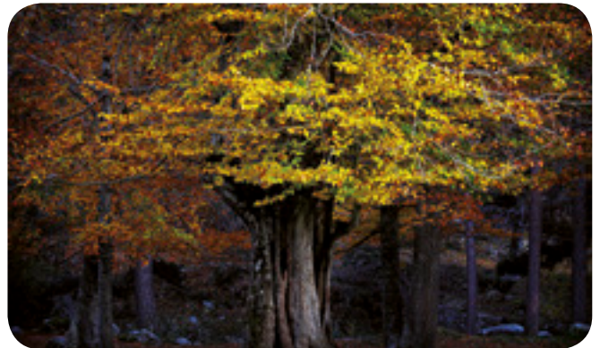
2 o premio: Ángel Benito Zapata "El viejo".