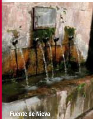
Fuente de Nieva

Formando una parte destacada del conjunto urbanístico de los pueblos serranos aparecen las plazas, espacios libres en donde la arquitectura y el paisaje se unen con las costumbres y tradiciones populares. Estos lugares habituales de convivencia suelen estar ligados a la existencia de templos parroquiales, único lugar cubierto que permitía reunir a toda la comunidad, y que se completa con un espacio exterior, a veces porticado, de gran importancia en la vida social del pueblo. En otros casos, las plazas se