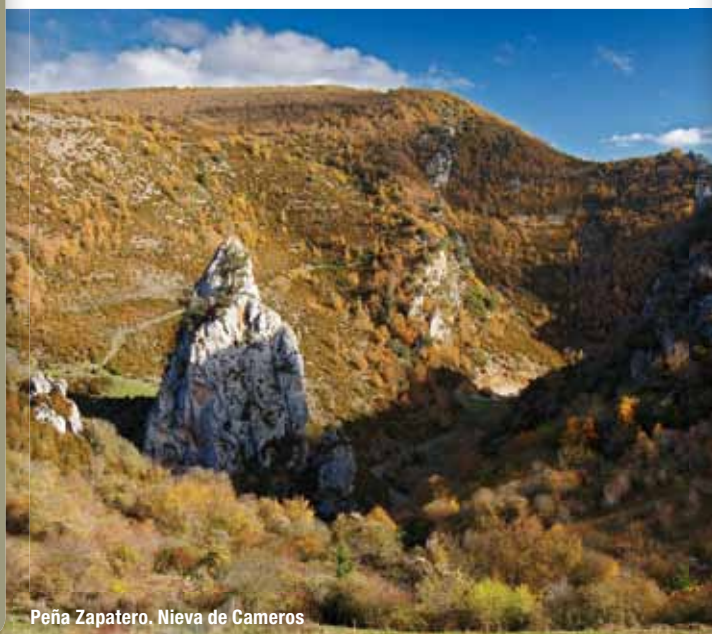
Peña Zapatero, Nieva de Cameros