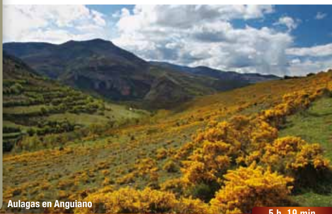
Aulagas en Anguiano

Abandonar la pista girando a la izquierda por un camino que se interna en el hayedo que cubre la umbría del barranco. El descenso es suave al principio para empinarse mientras el camino se estrecha y va tomando la forma de senda hasta salir del hayedo. La pendiente se acentúa por sendas de ganado al lado de una valla, hasta girar a la derecha cruzar una portilla y descender hasta una calle que se baja a la izquierda hasta la carretera y el aparcamiento del pueblo.