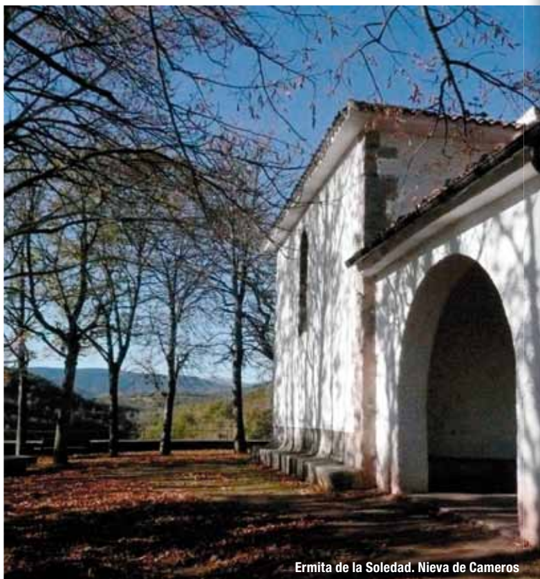
Ermita de la Soledad. Nieva de Cameros

relacionan con la presencia de edificios civiles, como los ayuntamientos, y, en otros muchos, mantienen una función de esparcimiento como zona de paseo y juegos.