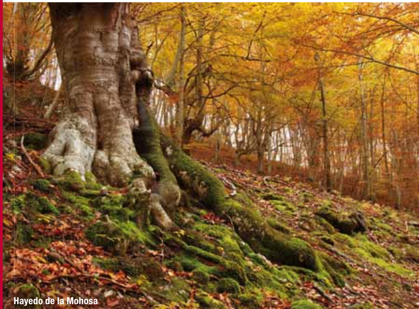
Hayedo de la Mohosa

Los hayedos, como bosques exigentes en humedad, constituyen en La Rioja enclaves de carácter atlántico que buscan refugio en los valles más favorables de las Sierras Ibéricas. Así, estos bosques caducifolios se asientan en las laderas más umbrías y resguardadas o en aquellas zonas afectadas por las nieblas. A medida que las condiciones ambientales de las montañas se van haciendo más mediterráneas, tal y como sucede si nos desplazamos desde Ezcaray hacia Cervera, los hayedos comienzan a ser cada vez más escasos. A partir de los valles del Leza y del Cidacos, las masas de haya tan sólo sobreviven en las zonas más altas de la cuenca, caso de los hayedos de Monte Real, de Santiago y de Poyales, para desaparecer por completo en el valle del Alhama.