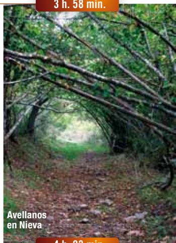
Avellanos en Nieva