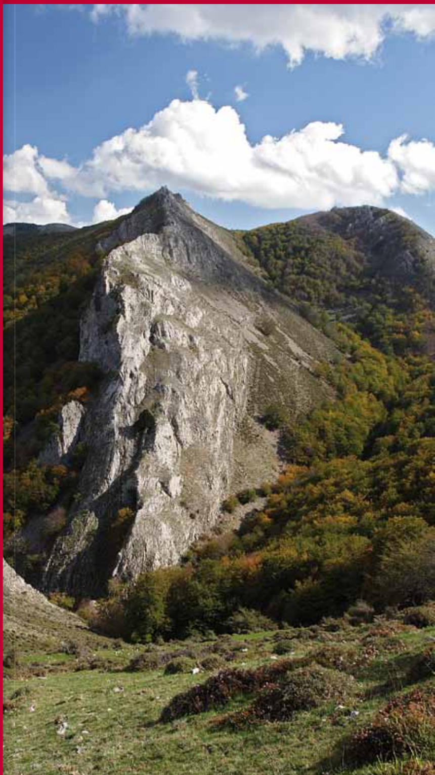
Tejo milenario en las peñas de Valle Gimeno. Anguiano