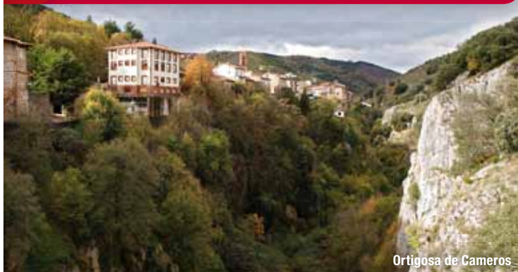
Ortigosa de Cameros

Final de etapa y posibilidad de visitar las grutas.