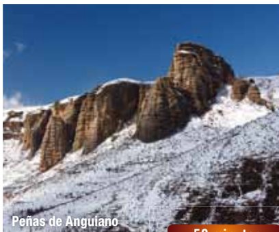
Peñas de Anguiano

Al cabo de un rato la empinada senda se adentra en el hayedo que cubre la umbría del barranco y se hace más ancha, para suavizarse y permitir acceder a un collado donde se encuentra una pista.