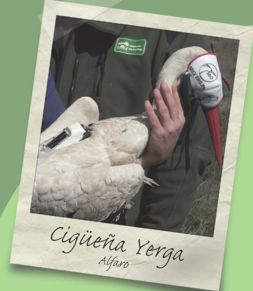
Cigüeña Yerga Alfaro