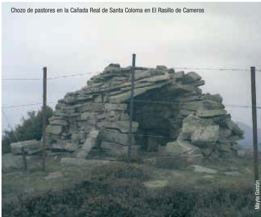
Chozo de pastores en la Cañada Real de Santa Coloma en El Rasillo de Cameros