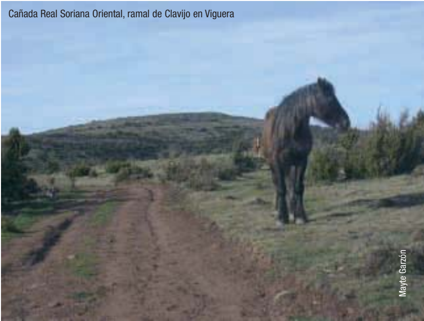
Cañada Real Soriana Oriental, ramal de Clavijo en Viguera

dirige a Brieva pasando por Ventrosa, y asciende a Peña Hincada en la mojonera entre Brieva y Ortigosa, donde enlaza con la Vía n.º VII (Galiana). Continúa por la divisoria de aguas del Najerilla y el Iregua, coincidiendo con los límites de términos municipales de pueblos de los dos ríos, hasta el término municipal de Entrena, que atraviesa para alcanzar el de Lardero y cruzarlo hasta llegar al de Logroño, donde enlaza en Varea con la Vía n.º X (Cañada del Ebro).