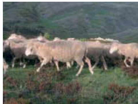
Rebaño de ovejas en al Cañada de Santa Coloma en Brieda de Cameros

La legislación establece que las vías pecuarias “son bienes de dominio público de la Comunidad Autónoma de La Rioja y, en consecuencia, inalienables,