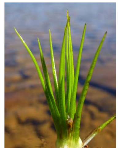
Isoetes echinosporum . J.I. Esquisabel