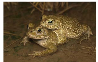
Sapo corredor ( Epidalea calamita ). J. Álvarez