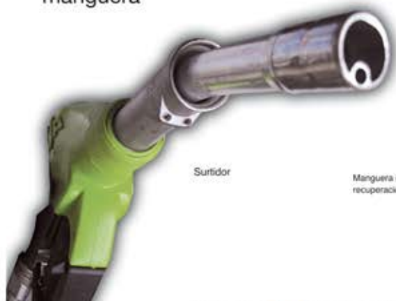
Esquema recuperación vapores fase II

Este surtidor evita la emisión de estos gases contaminantes (COV) por su doble manguera