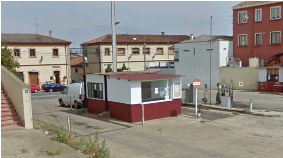
IMAGEN OTRAS 15.- ES NUESTRA SEÑORA DE VALVANERA. (AVIA). EL VILLAR DE TORRE