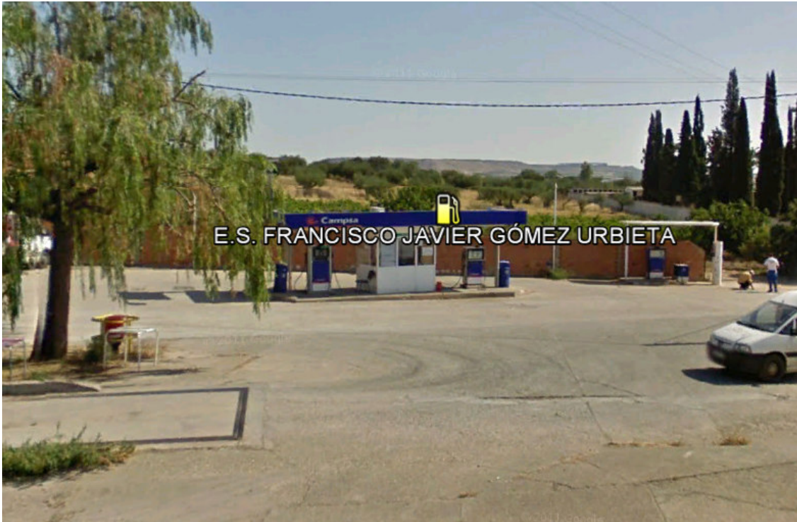
IMAGEN REPSOL 43 Y 44.- CRED DE VILLANUEVA DE CAMEROS. VILLANUEVA DE CAMEROS.

IMAGEN REPSOL 42.- ES FRANCISCO JAVIER GÓMEZ UBIETA. VILLAMEDIANA DE IREGUA.