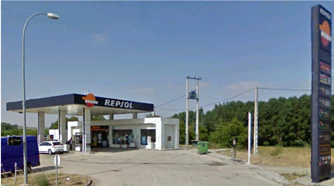
IMAGEN REPSOL 39 Y 40.- ES DE TRICIO. TRICIO