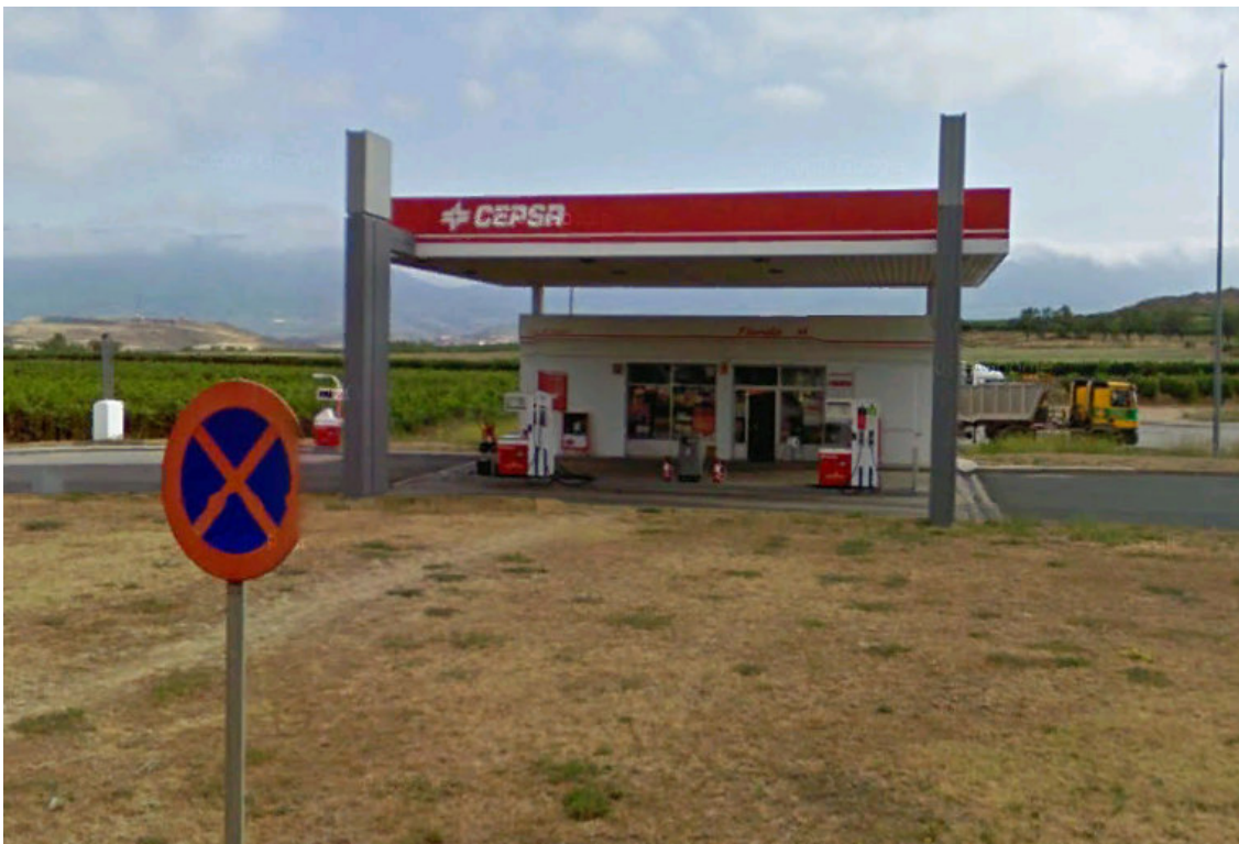
IMAGEN CEPESA 4. ES FUENMAYOR. FUENMAYOR