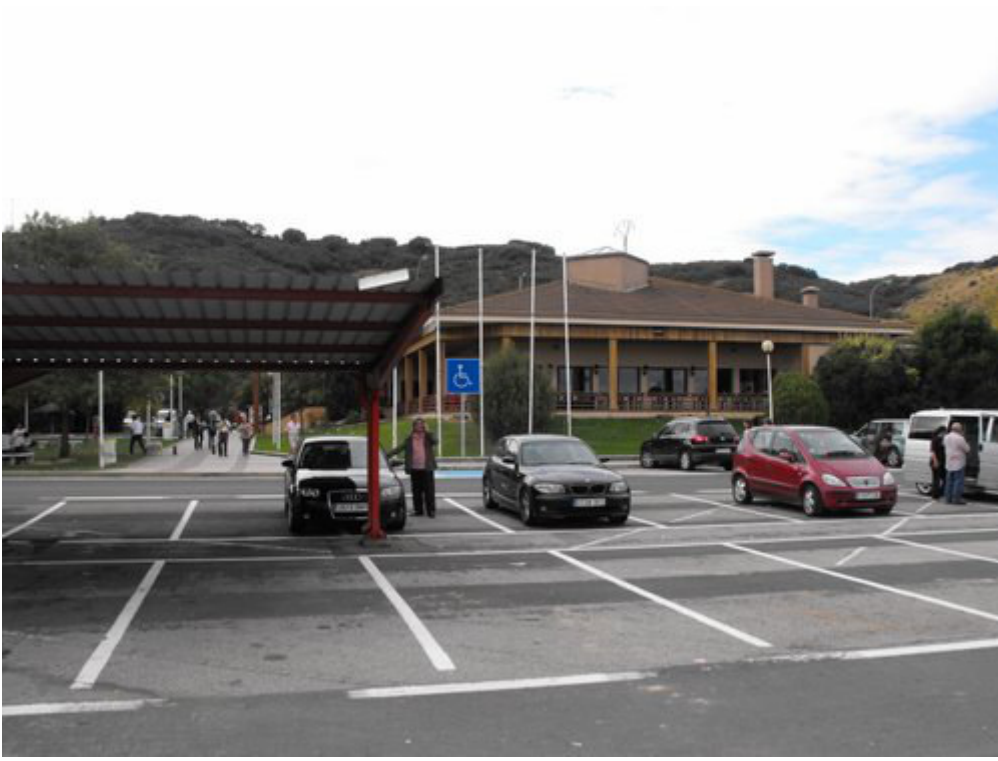
IMÁGEN REPSOL 27.- CRED DE PRADOVIEJO. LOGROÑO.