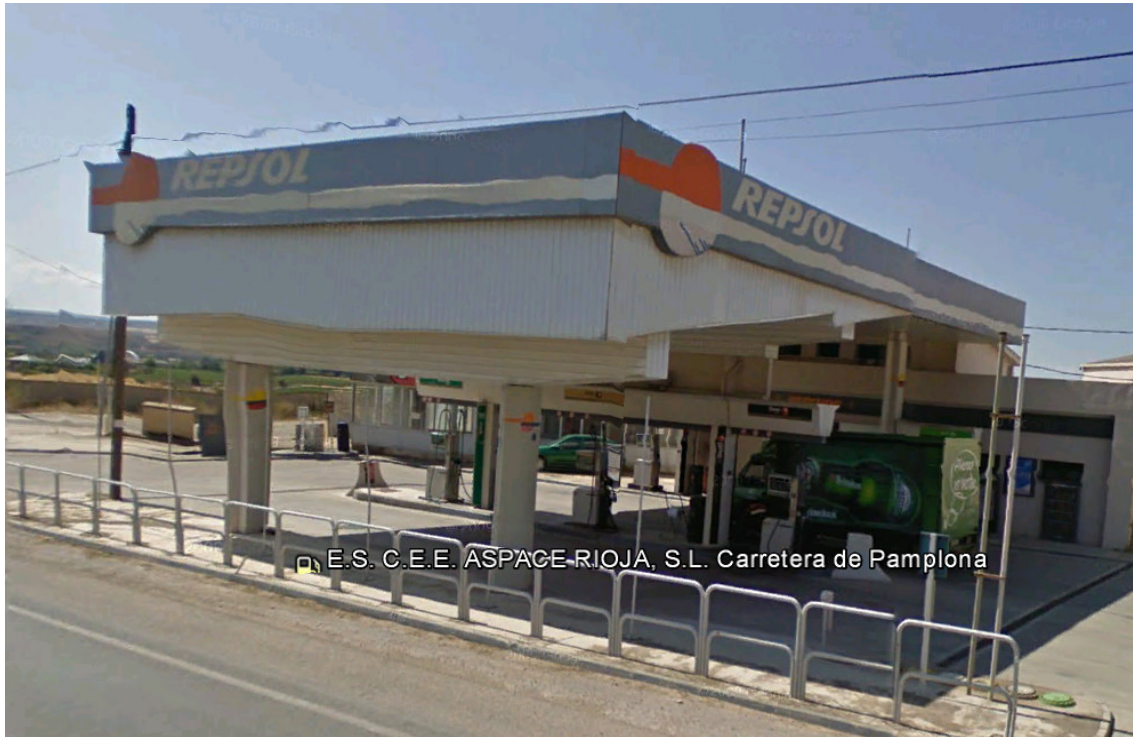
IMAGEN REPSOL 31.- SÁENZ DE JUBERA MURILLO DE RÍO LEZA