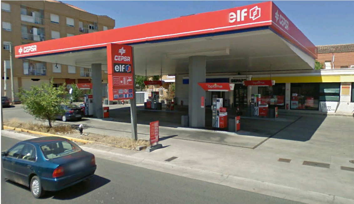
IMAGEN CEPESA 7. ES MURRIETA (DIRECCIÓN LOGROÑO), LOGROÑO