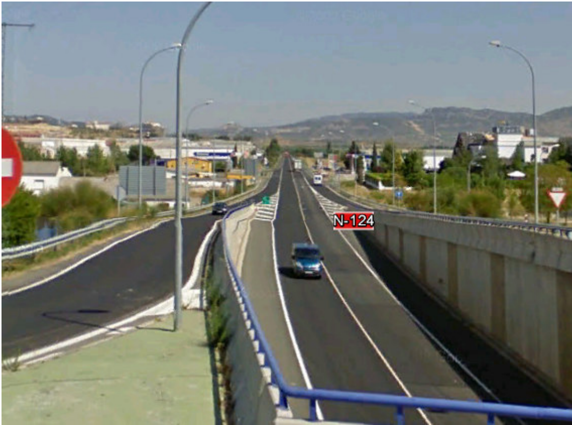
IMAGEN REPSOL 16 Y 17.- ES RUIZ, S.A. HARO. (N-124). Hay dos estaciones.