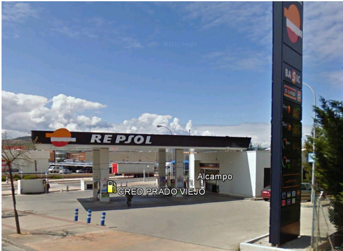
IMAGEN REPSOL 28.- ES LAS GAUNAS, S.A. LOGROÑO