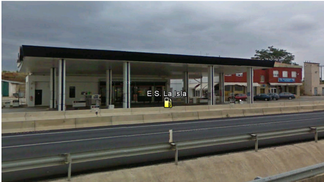
IMAGEN REPSOL 35.- CRED DE SAN ASENSIO (MI). SAN ASENSIO.