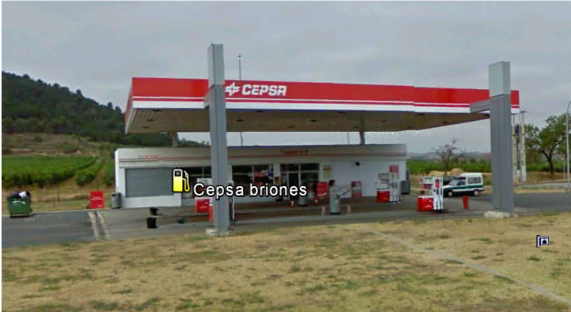
IMAGEN CEPESA 3. ES BRIONES (MI). BRIONES