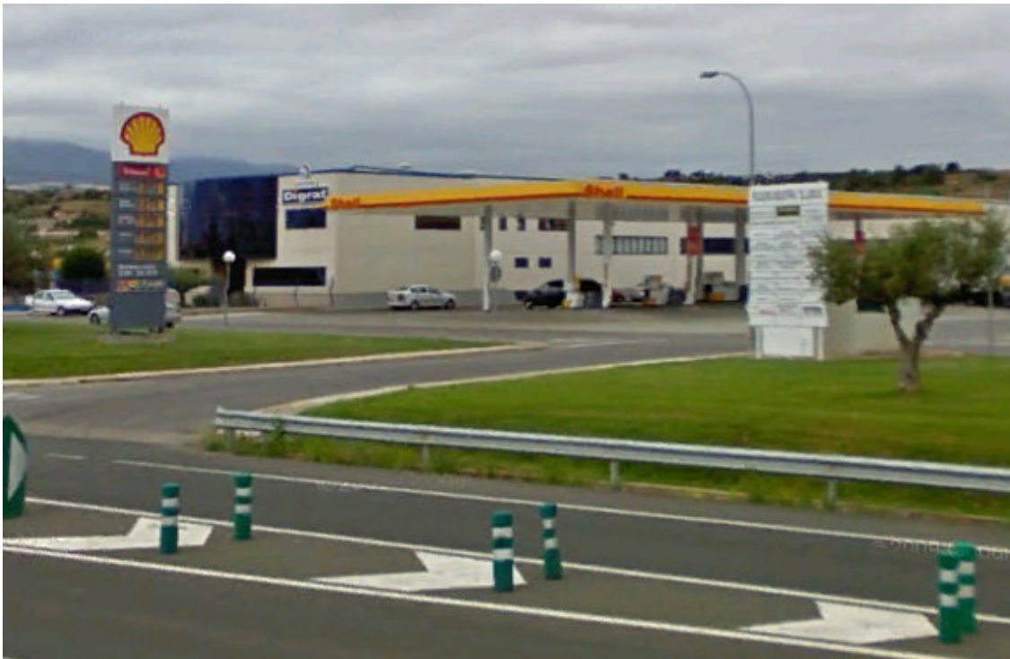
IMAGEN OTRAS 1.- ES VALLE SUFRATEGUI PADILLA. SHELL. ALBELDA