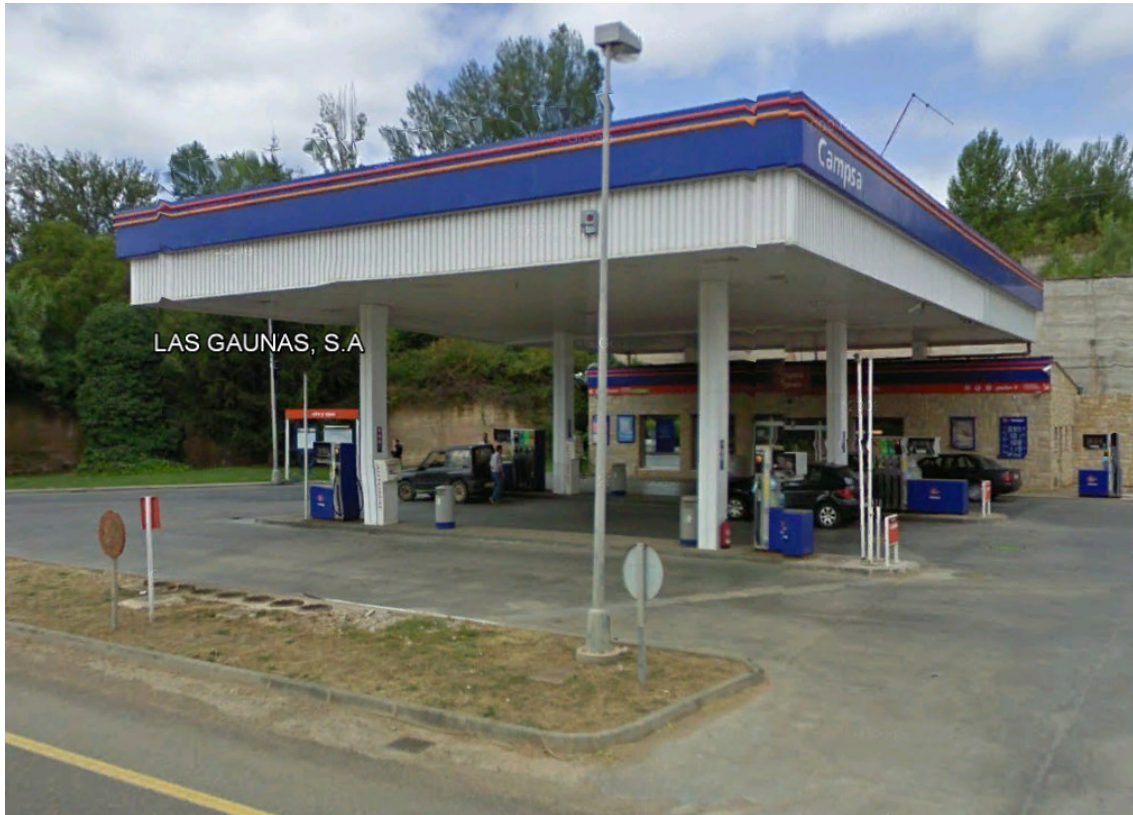
IMAGEN REPSOL 33.- ES SAN JUAN II PRADEJÓN.