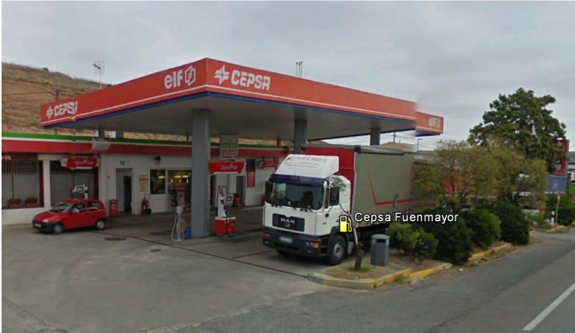
IMAGEN CEPSA 5. ES MONTECORVO. LOGROÑO