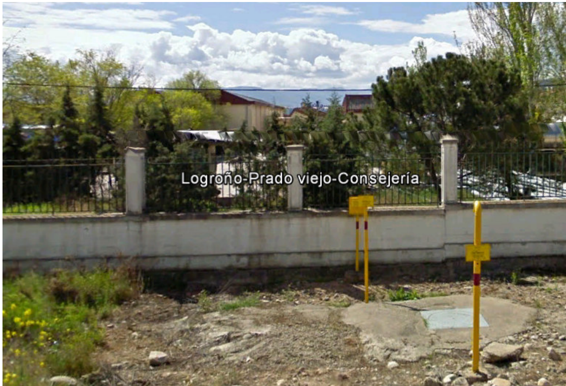
IMAGEN OTRAS 11.- EROSKI BERCEO. LOGROÑO

IMAGEN OTRAS 10.- ES CONSEJERÍA DE MEDIO AMBIENTE EN LA CALLE PRADOVIEJO. LOGROÑO.