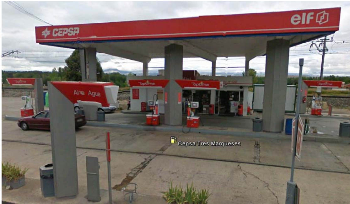
IMAGEN CEPSA 10. ES TRES MARQUESES (MD). AGONCILLO.