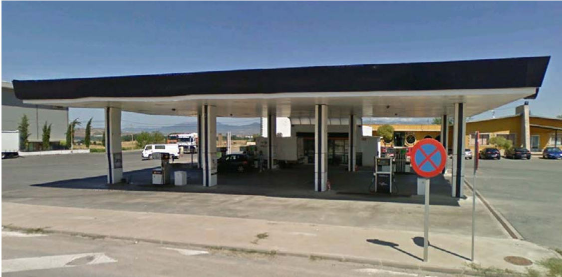
IMAGEN REPSOL 41.- ES AURORA E HIJOS, S.L. VALVERDE (CERVERA DE RÍO ALHAMA)