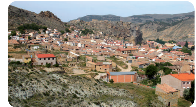
Cervera del Río Alhama

El matorral mediterráneo de las deforestadas laderas alberga un buen número de plantas aromáticas como el romero, el tomillo o la lavanda .