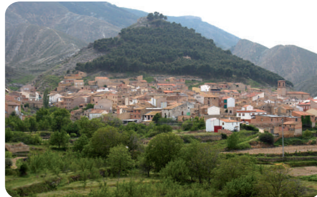
Aguilar del Río Alhama

El camino entra en Cervera del Río Alhama a la altura de la carretera LR-123. Seguimos la carretera en dirección a Cabretón y Valverde, pasando junto al antiguo matadero municipal, y giramos a la derecha antes de llegar a una curva. Este primer tramo coincide con el GR 93 "Sierras de La Rioja" etapa 11 Cervera del Río Alhama - Valverde. Saliedo del casco urbano encontramos unas escaleras a mano izquierda que suben al mirador de Cervera. Pasado algo más de un kilómetro, el camino que llevamos sigue por la ribera del Alhama, mientras el Sendero Sierras de La Rioja se desvía a la izquierda.