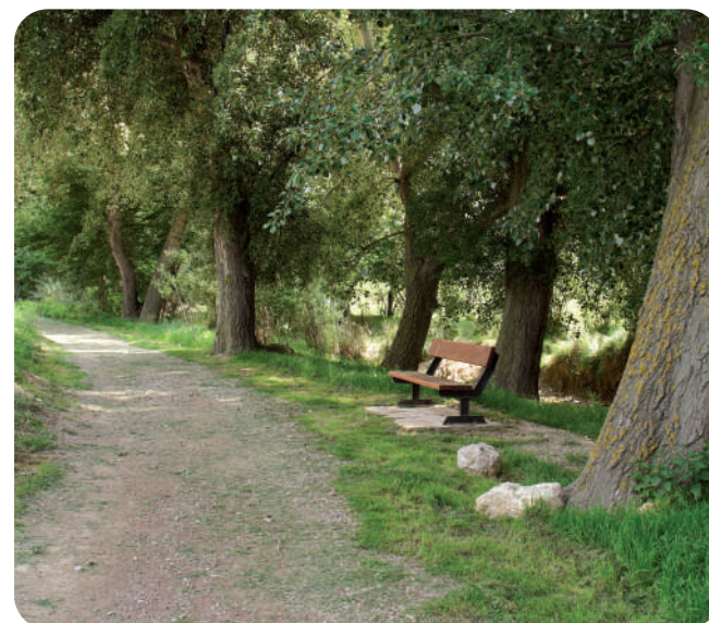
Soto en Inestrillas

A partir de aquí el camino recorre el valle del Alhama muy próximo a cortados calizos de origen fluvial y más adelante pasa junto a uno de los yacimientos celtíberos de mayor interés en el contexto peninsular, el yacimiento arqueológico de Contrebia-Leukade. El camino bordea el cerro en el que se asienta y se dirige entre huertas hasta la entrada de Inestrillas, donde se cruza la carretera LR-284 que va a Aguilar del Río Alhama. El río se cruza un poco más adelante por una pasarela que lleva al centro de la población. Hay que seguir por las calles del pueblo hacia el este, donde el camino continúa un kilómetro más entre huertas hacia Aguilar del Río Alhama. El camino termina al encontrarse con la carretera LR-409 de Aguilar a Valdemadera.