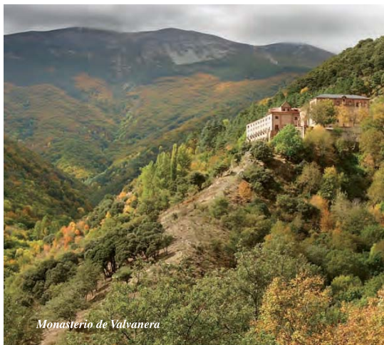
Monasterio de Valvanera

Encinar montano, hayedo, bosques mixtos con grandes arces y fresnos, robles rebollos, abedules y pinar de silvestre.