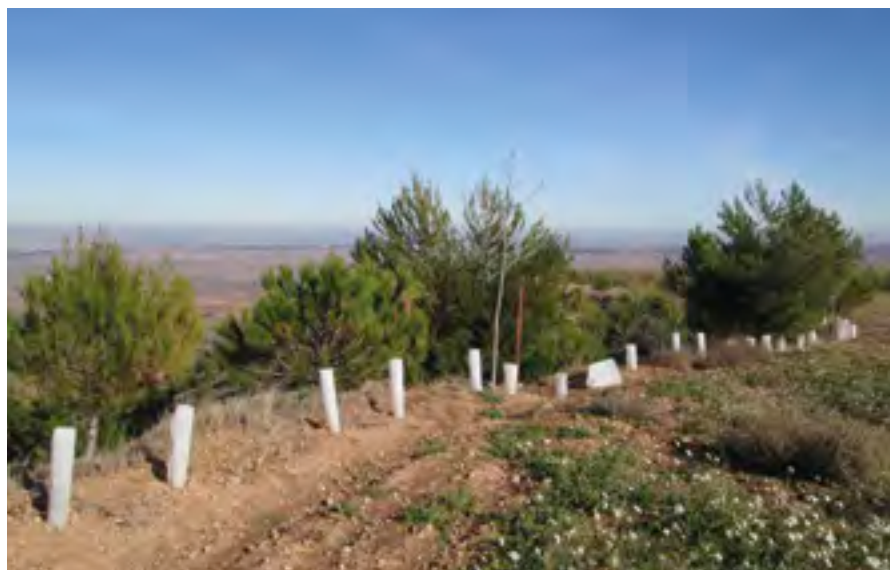
Proyecto de forestación en Clavijo. Año 2003.

Sin embargo, si la gestión es intensiva, la plantación se cortará al menos una vez a lo largo del periodo de permanencia, lo que produciría la "liberación" a la atmósfera del carbono absorbido por la misma. Para solucionar este problema, en plantaciones de este tipo se supone que la absorción total de la plantación se corresponde con un valor medio, por lo que se tendrá como referencia la mitad del carbono total absorbido a lo largo del turno, pudiéndose destinar para compensación ex ante el 20% de dichas absorciones, llegando posteriormente hasta el 100% de las absorciones de referencia. Por último, cabe mencionar que en ambos casos se descuenta un 10% de esa