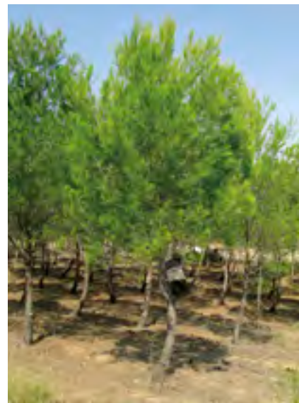
Villarroya, reforestación de 1998.

El carbono absorbido correspondiente a la forestación se contabilizará de manera distinta según el tipo de gestión seguido en la masa. Así, en los proyectos que sigan una gestión no intensiva -como se comentó anteriormente, aquellos en los que el turno de corta de la masa sea mayor que el periodo de permanencia establecido- se tendrá como referencia todo el carbono absorbido, si bien solamente se podrán destinar para compensación ex ante el 20% del mismo. Esto quiere decir que el propietario forestal sólo podrá realizar una transacción monetaria de manera anticipada utilizando el 20% de dicho carbono, pudiendo destinar para compensación el resto de absorciones conforme estas vayan teniendo lugar.