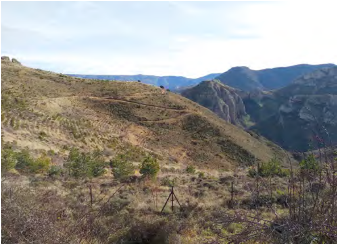
Reforestación realizada en el término municipal de Tobía en el año 2006.