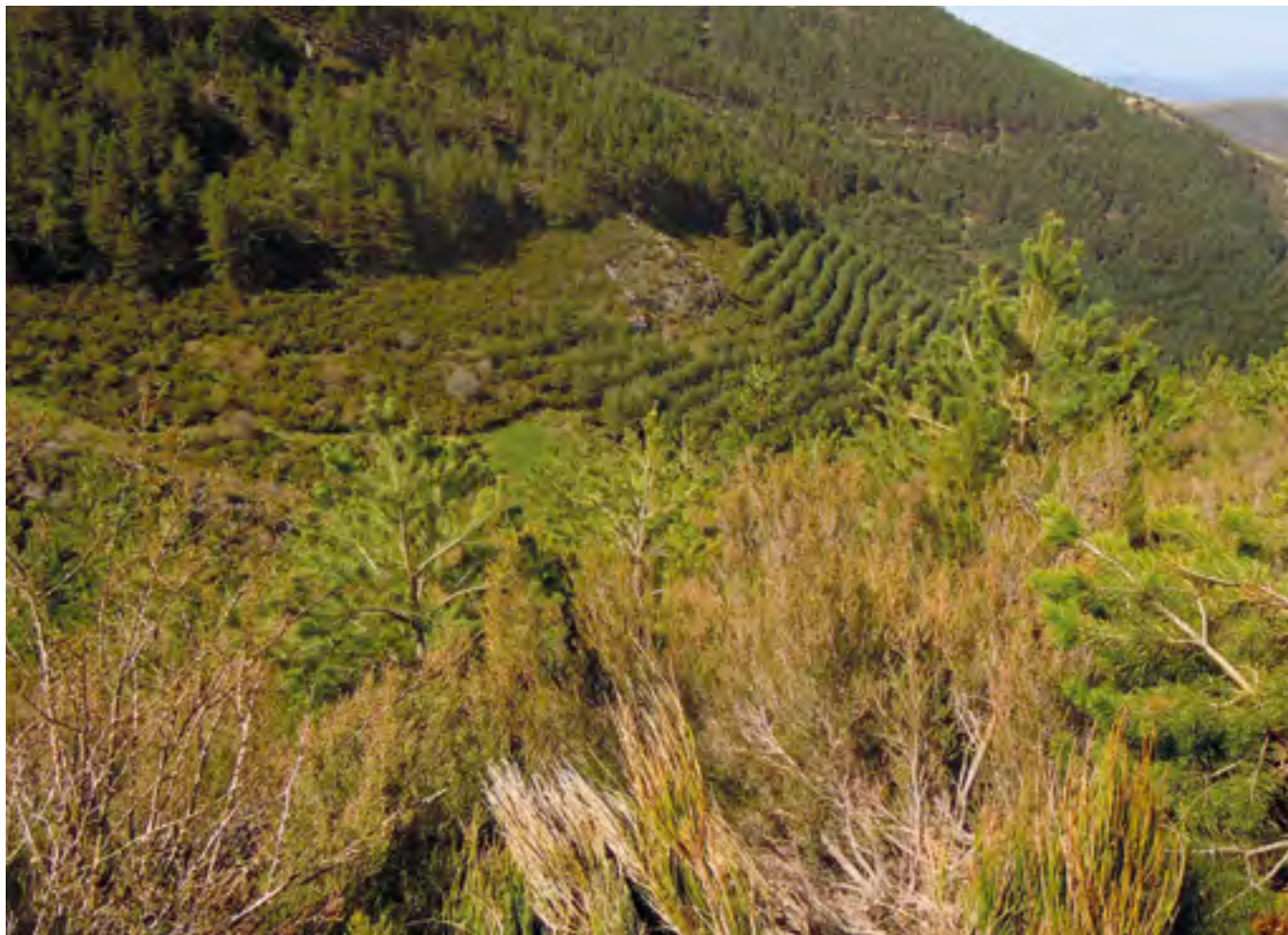
Forestación en Ventrosa de La Sierra.

cantidad disponible para compensar, destinándose a una bolsa de garantía creada con el objetivo de cubrir las absorciones que pudieran perderse por causa de fuerza mayor.