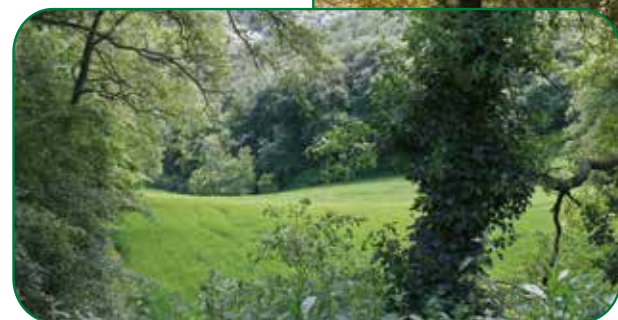
Dehesa de Suso

Otro repecho de poca dificultad nos lleva hasta un camino que cruza el bosque. A la derecha se enlaza con el camino a Villar de Torre. Cogiendo el desvío de la izquierda, vamos poco a poco abandonando el pinar para adentrarnos en un robleal de quejigos ( Quercus faginea ).