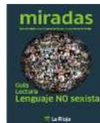
Lenguaje no sexista