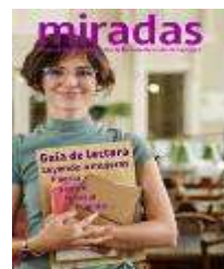
Leyendo a mujeres