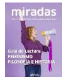
Feminismo, filosofía e historia