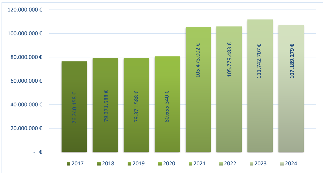
Figura 1. Evolución del presupuesto del Gobierno de La Rioja destinado a actividades de I+D+i

Todos los datos aquí consignados se corresponden con la información suministrada desde la Consejería de Hacienda en el momento de la carga de los presupuestos definidos por parte de cada uno de los órganos gestores en el año correspondiente.