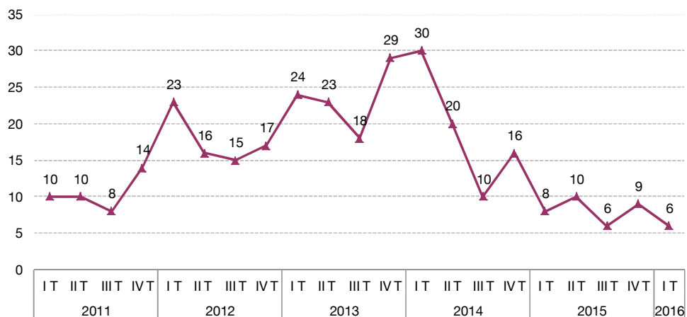
Evolución del número de deudores concursados en La Rioja

Atendiendo a la clase de procedimiento, durante el primer trimestre del año se presentan en La Rioja cinco procesos abreviados y uno ordinario.