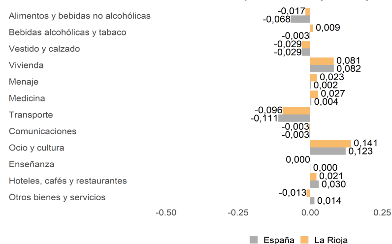
IPC Repercusiones por Grupos