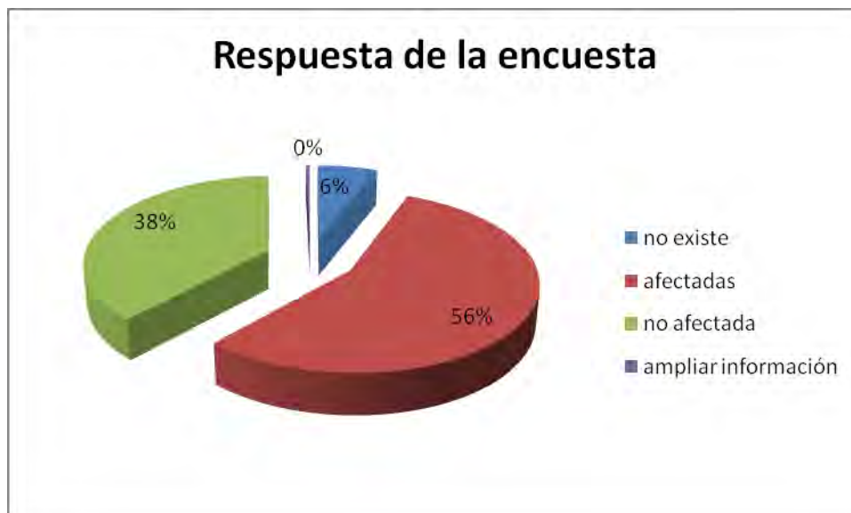
Figura B.5. Resultados de la encuesta realizada.

A continuación se incluyen una serie de gráficos que permiten visualizar todos estos resultados.