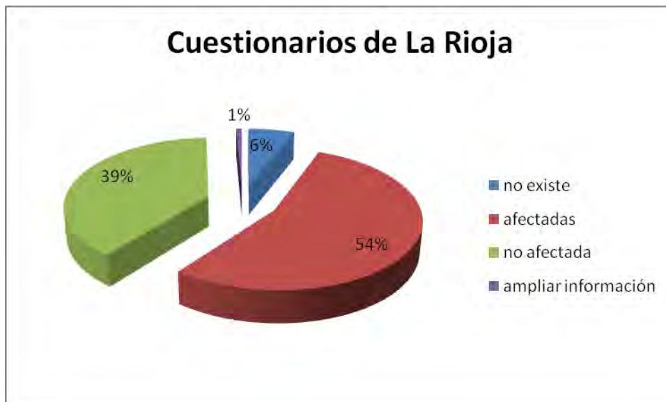
Figura B.6. Resultados de la encuesta realizada a las empresas situadas en La Rioja.