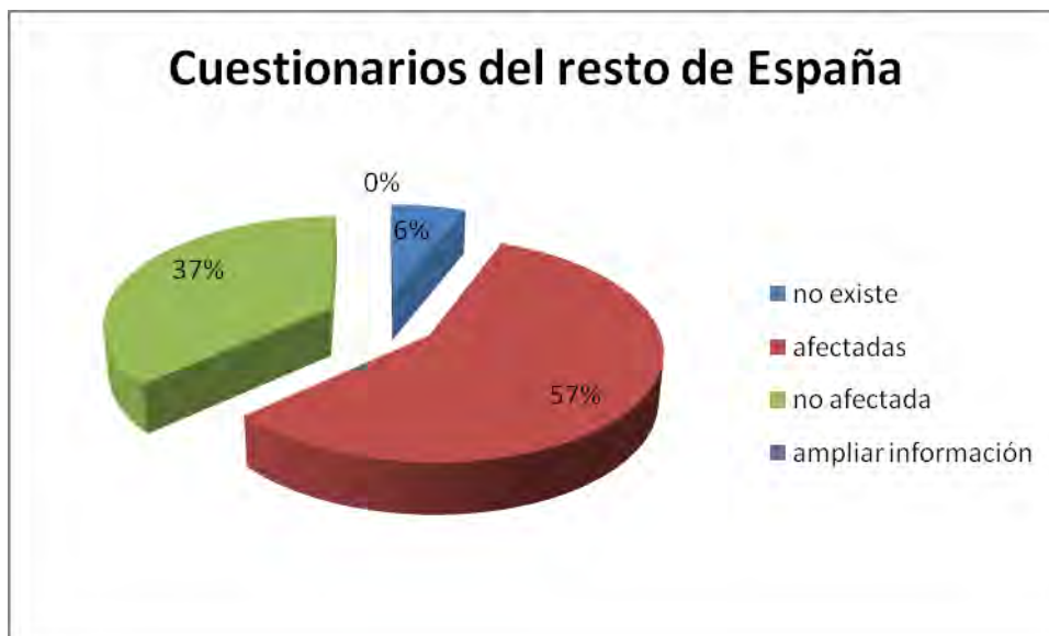
Figura B.7. Resultados de la encuesta realizada a las empresas situadas en el resto de España.

Durante el periodo de envío de cartas y recepción de respuestas se realizó una labor de asesoría técnica para intentar resolver las dudas con las que se encontraron las empresas a la hora de completar el boletín. Dicha asesoría se realizó a través de teléfono y correo