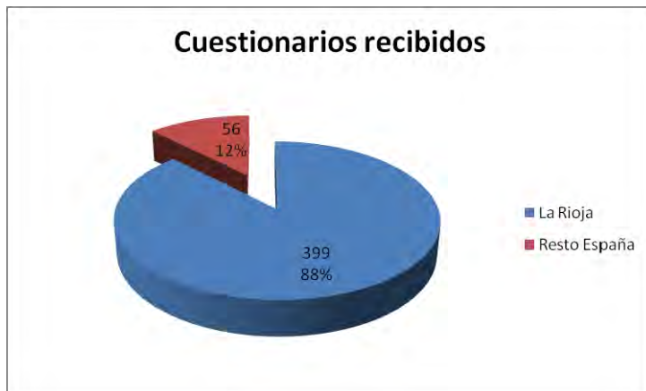
Figura B.4. Reparto entre empresas situadas en La Rioja y empresas situadas fuera de los cuestionarios recibidos.