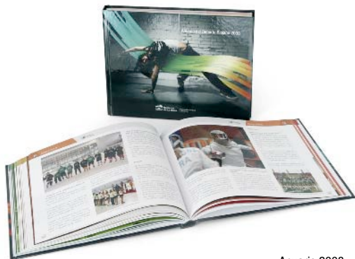
■ Anuario 2008

La Fundación Rioja Deporte colabora con la Asociación de la Prensa Deportiva. Entre las novedades más importantes de este año destaca la puesta en marcha de un espacio informativo en internet ( www.deporteriojano.com ) dedicado a la actividad de los deportistas de La Rioja y la labor de gabinete de prensa que hará la Asociación con aquellas federaciones que lo requieran. Además, la ARPD pondrá a disposición del colectivo deportivo su sede para la celebración de actividades, tales como ruedas de prensa.