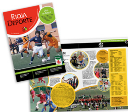
■ Revista 12

acudieron a distintos colegios de La Rioja para promocionar el deporte escolar. Los deportistas cuentan sus experiencias, hacen demostraciones y animan a los niños a que practiquen deporte. También se ofreció la posibilidad de que los escolares de La Rioja visitaran el Palacio de los Deportes para ver cómo realizan los entrenamientos el Club Baloncesto Clavijo y el Naturhouse La Rioja.