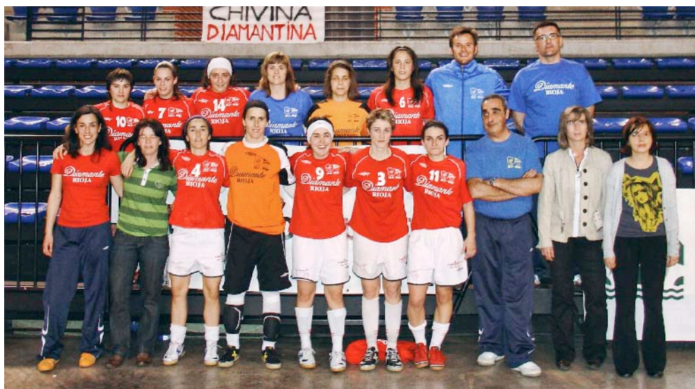
■ Club Diamante Rioja 2009

Rioja. La Fundación organiza el uso de las instalaciones del Palacio de los Deportes para que estos tres equipos riojanos realicen sus entrenamientos y disputen sus encuentros oficiales. En los Convenios se recoge el compromiso de la Fundación de colaborar con los clubes asumiendo el coste de mantenimiento y uso de la instalación, en todas sus dependencias para su uso durante la temporada. En contraprestación los clubes deberán participar en todas aquellas actividades que organice la Fundación para promocionar el deporte y facilitar un número de entradas para que la Fundación lo ponga a disposición de sus colaboradores