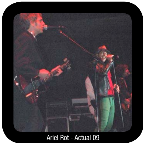
Ariel Rot - Actual 09