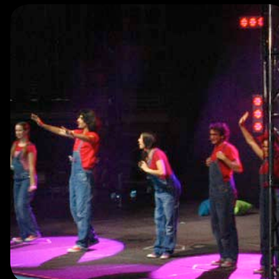
Espectáculo Canta Juegos