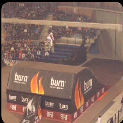
Cto. de España de Freestyle