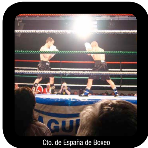
Cto. de España de Boxeo