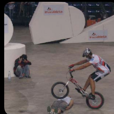
Exhibición de Trial y Bike-Trial