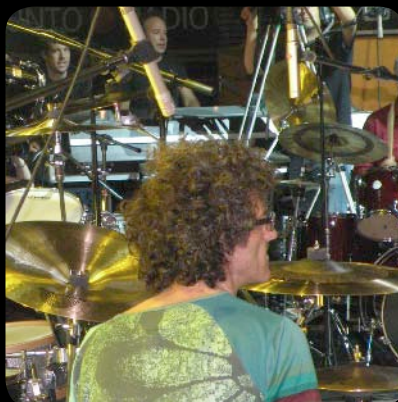
V Drumming Festival de Percusión