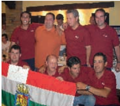
Equipo ganador del Cto. de España de Salmónidos

La comunidad de La Rioja se alzó con el triunfo por equipos en el XXXVII Campeonato Nacional de Pesca de Salmónidos Lance Ligero,