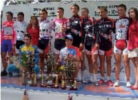
Ganadores Vuelta Ciclista a La Rioja Júnior