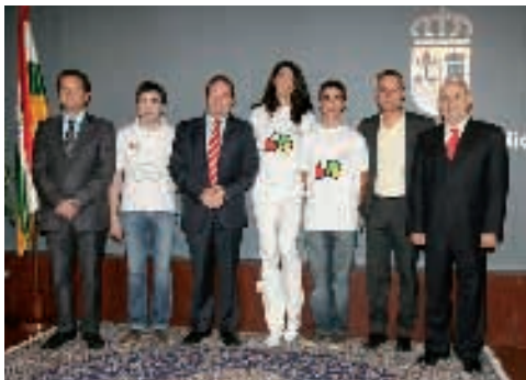
Presentación de los tres olímpicos riojanos