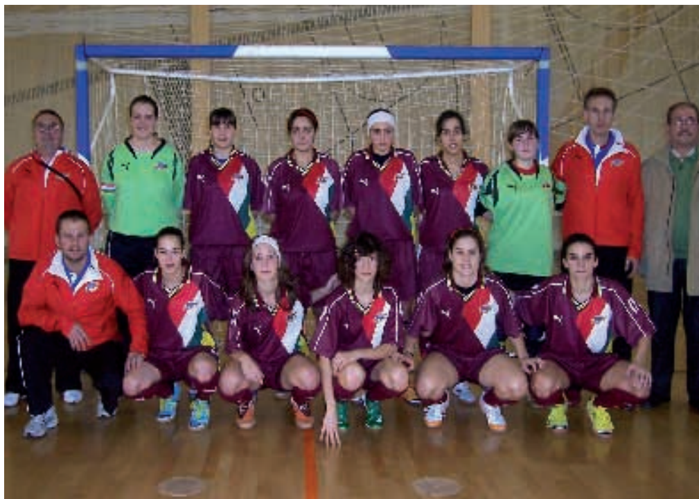
Selección Femenina de Fútbol Sala

El fútbol femenino es una realidad en La Rioja, cada temporada son más las jóvenes deportistas que lo practican, el desarrollo y trabajo que realiza la federación poco a poco va cosechando sus frutos.