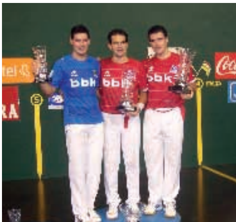
Final de la Feria de San Mateo

De esta manera, el delantero riojano conquista su séptimo título de San Mateo, después de dos años de sequía.