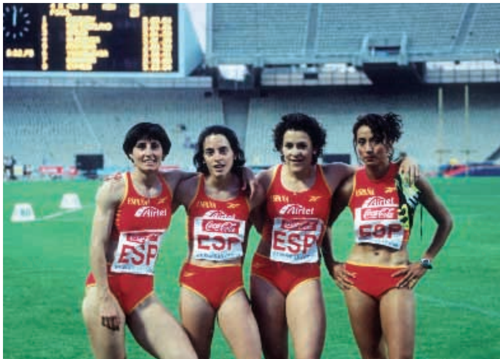
Copa de Europa 1999 en Atenas