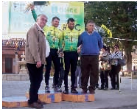
Entrega de los premios del Tandem Ciclismo en Ventas Blancas

Las primeras Jornadas de Ciclismo Profesional fueron organizadas por el Club Ciclista Logroñés en su setenta y cinco aniversario de historia como club. Unas jornadas que se celebraron en el mes de noviembre y diciembre y en las que se dieron cita los ciclistas profesionales del Caisse D'Epargne y Euskatel-Euskadi, así como organizadores de carreras profesionales y médicos especialistas en la materia de este deporte.