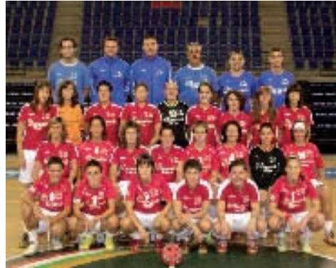
Diamante Rioja. Categorías Honor y Plata

Podría parecer insólito el hecho de que una modalidad deportiva que mueve a nivel regional tan pocas licencias pueda tener tres equipos en competición nacional, pero revisando la historia deportiva de esta modalidad hay datos relevantes.