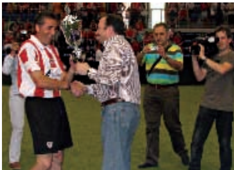
Entrega de trofeos en el I Torneo Fútbol Indoor

El Palacio de los Deportes registró la mayor entrada con más de cinco mil personas. El triunfo de la selección española de fútbol convirtió el