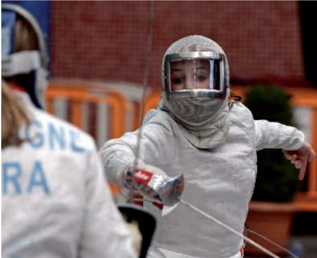
Copa del Mundo Júnior de sable femenino en el polideportivo Las Gaunas