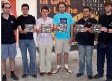
Ganadores sector norte del Cto. España Ajedrez Absoluto

El XXIV Cross Ciudad de Haro, que contó con un millar de participantes entre todas las ca-