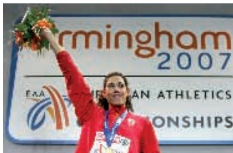
Campeonato de Europa Pista Cubierta en Birmingham 2007