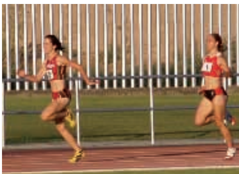
Gran Premio de Zaragoza