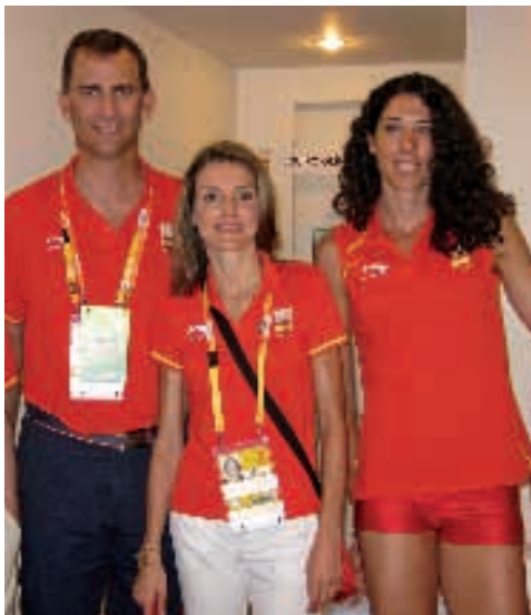
Carlota con los Príncipes de Asturias