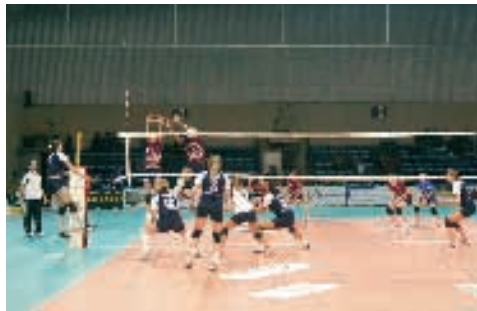
Haro Rioja Voley

El Haro Rioja Voley se proclamó campeón de la primera edición de la Copa Princesa de Asturias que enfrentó en la ciudad de Miranda de Ebro a los tres mejores clubes clasificados en la Superliga Femenina 2 al término de la primera vuelta: el Haro Rioja Voley, el Cantabria Infinita y el Universidad de Granada. Junto a ellos, participó el Promociones Díez Rical Miranda, equipo anfitrión.