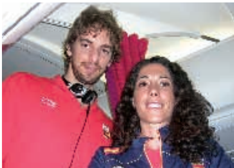
Carlota Castrejana con Pau Gasol