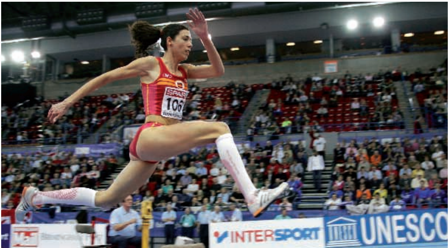
Campeonato de Europa Pista Cubierta en Birmingham 2007