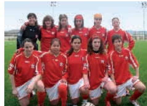
Club At. Revellín

Por último, F.S. Calceatense pertenece al Grupo I, que abarca equipos de la zona Norte y Galicia. Este equipo es el referente de la modalidad de Fútbol Sala Femenino en La Rioja Alta. De estos clubes, el Diamante dispone además de equipo en categoría territorial y dos equipos