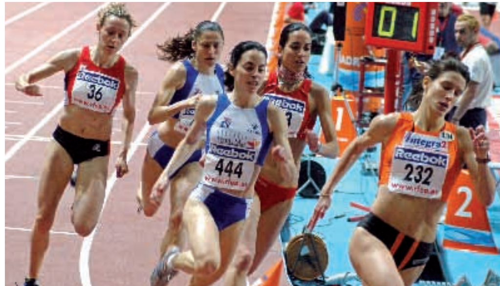
Campeonato de España 2005