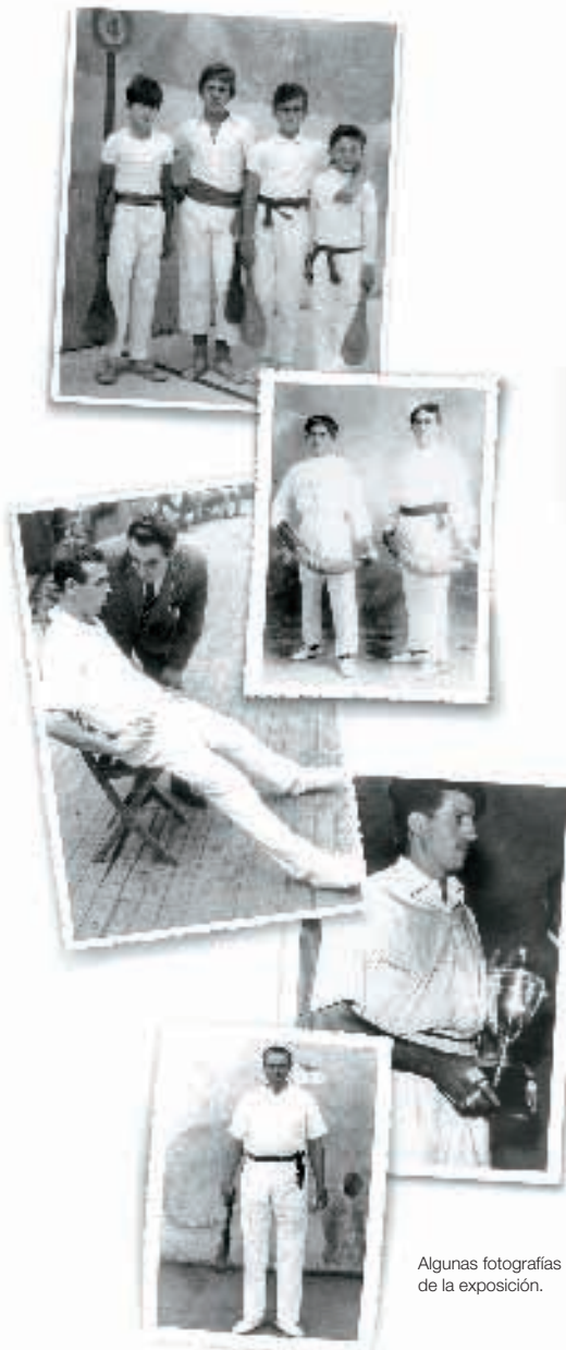
Algunas fotografías de la exposición.