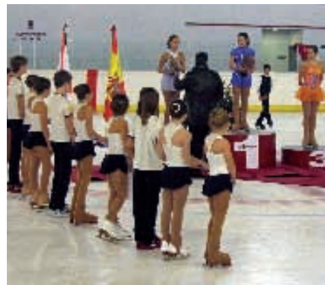
Entrega de Premios Cto. España de Patinaje Artístico

Es el primer paso importante que dio la federación nacional para que puedan competir a nivel internacional y en ello están los responsables federativos.