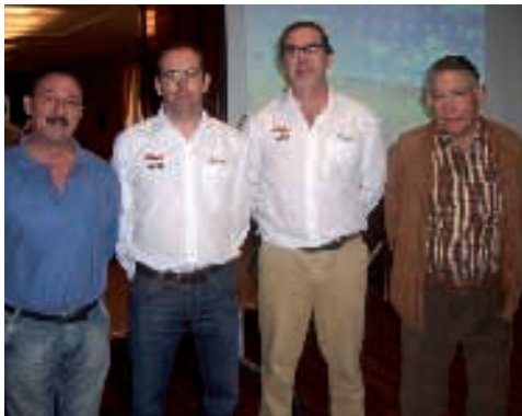
Miembros de las federaciones riojana y española de ciclismo

La Vuelta fue un éxito total de organización y participación, y sobre todo se pudo ver en las carreteras riojanas a los mejores corredores nacionales de la categoría. La selección de Ma-