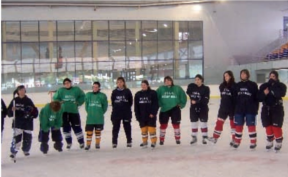
Concentración de la selección femenina de hockey sobre hielo en el polideportivo de Lobete