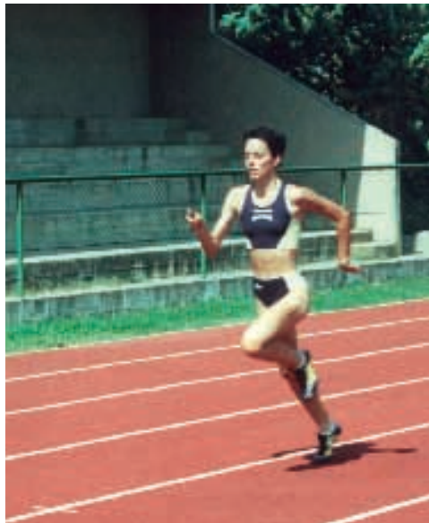
Concentración 4 x 400. Sabiñánigo. Agosto 2000