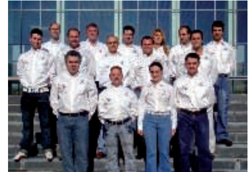
Junta directiva del Club Ciclista Logroñés