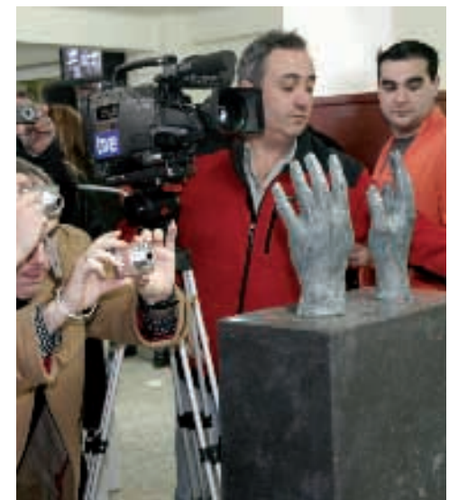
Escultura en bronce de las manos de Titín III

objetos que forman parte de sus recuerdos y que hoy se exponen como una pieza importante del folclore riojano.