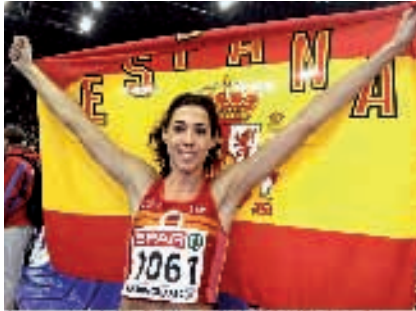
Campeonato de Europa Pista Cubierta en Birmingham 2007