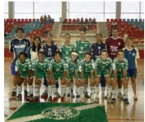
Palmeiras de Brasil, ganador del Trofeo Ciudad de Logroño

El tercer puesto fue para el Valladolid que superó al Kupsa Teccan Logroño por un corto 1-0.