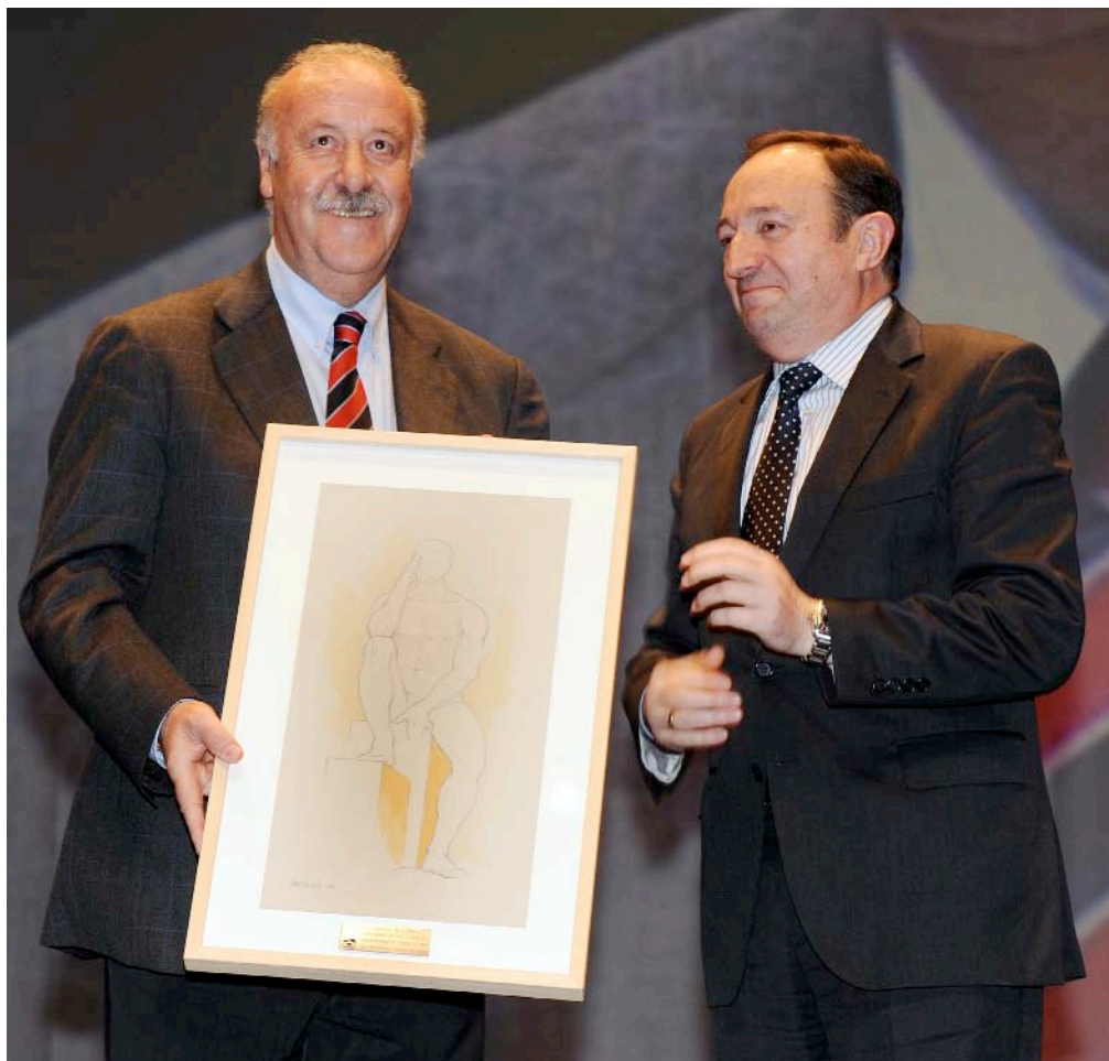
■ Vicente del Bosque, seleccionador nacional de fútbol, junto a Pedro Sanz, presidente del Gobierno de La Rioja