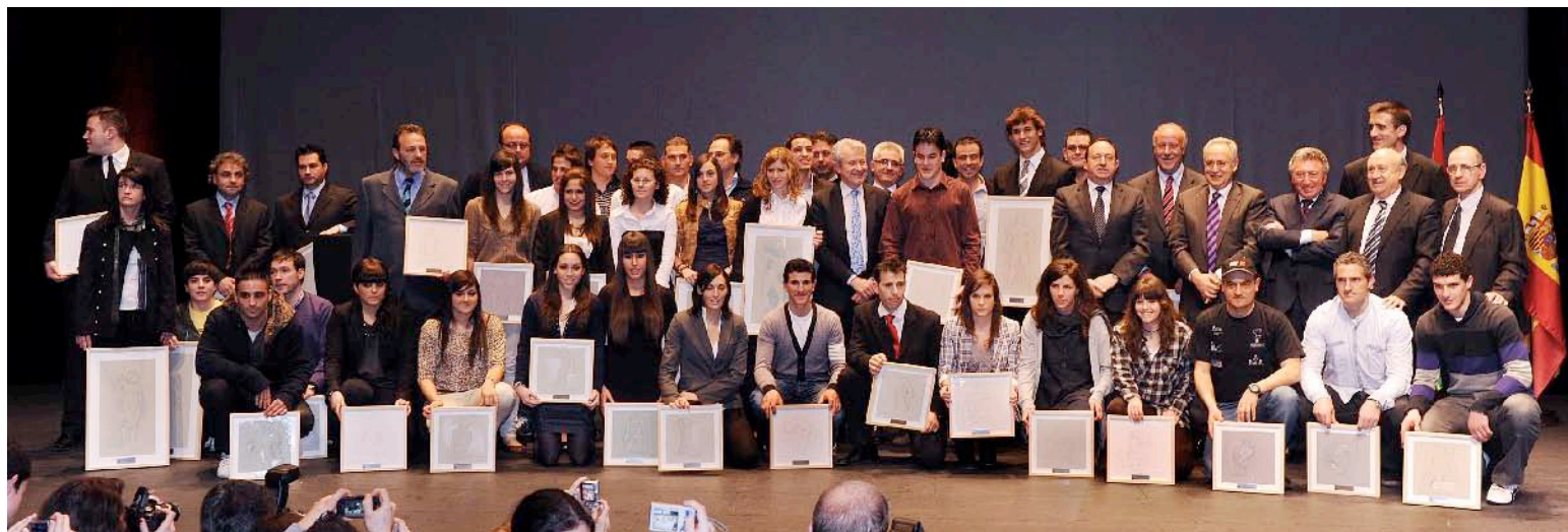
■ Foto de familia de todos los premiados en la Gala del Deporte Riojano 2010