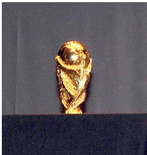
■ La Copa del Mundo presidió la Gala del Deporte 2010

Vicente del Bosque, seleccionador Nacional de fútbol, subió a recoger la Mención de Honor Del Deporte que otorgó el Gobierno de La Rioja por el logro histórico obtenido en el Mundial de Sudáfrica 2010 donde la Roja ganó la primera estrella de campeón del Mundo. La Mención de Honor le fue entregada de manos del presidente del ejecutivo regional, Pedro Sanz, bajo un aluvión de aplausos de todo el Auditorio.