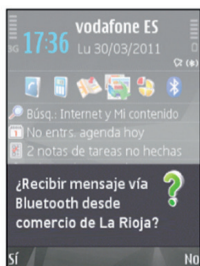
1 El emisor Bluetooth envía una invitación al usuario.

Las ventajas de alimentar el servicio con información actualizada es evidente; para el usuario, porque cuanto más rica sea su oferta y su conocimiento del comercio riojano más se incentiva la compra en comercio riojano y para el comerciante, porque rentabilizará al máximo y sin coste alguno la inmensa difusión y publicidad que este nuevo canal comercial le ofrece.