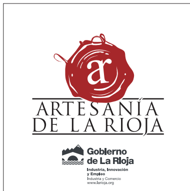
Version 2 tintas

La denominación ARTESANÍA DE LA RIOJA es un distintivo otorgado por el Gobierno de La Rioja que acredita y reconoce el origen y la naturaleza artesanal de productos elaborados por empresas y artesanos de La Rioja. The name CRAFTWORK DE LA RIOJA is a badge awarded by the Government of La Rioja which accredits and recognizes the origin and nature of handmade products made by companies and artisans of La Rioja. Le nom ARTISANAT DE LA RIOJA est un badge délivré par le gouvernement de La Rioja, qui accrédite et reconnaît l'origine et la nature des produits fabriqués à la main par les entreprises et les artisans de La Rioja. Der Name HANDWERK DE LA RIOJA ist ein Abzeichen, die von der Regierung von La Rioja, die akkreditiert und erkennt die Herkunft und die Art der handgemachte Produkte, die von Unternehmen und Handwerker der Region La Rioja.