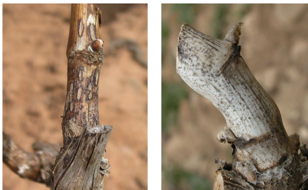
Síntomas de excoriosis en los primeros entrenudos del sarmiento.

Para controlar la excoriosis es aconsejable realizar dos tratamientos en los estados C (punta verde) y D (salida de hojas) con algunos de estos productos: folpet ; mancozeb (pr. comunes); metiram (Polyram DF - Basf) y fluopicolida + propineb (Pasadoble - Bayer CS). Estos productos aplicados después del estado fenológico E (hojas extendidas) no son eficaces.