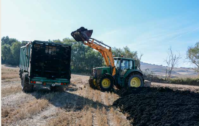
Los fangos son trasladados a la parcela y distribuidos sin coste para el agricultor.

Por lo tanto, como se puede ver reflejado en el cuadro, en los cultivos cerealistas es factible la sustitución total de abonos de procedencia química por los lodos de depuradora, ya que las necesidades de nitrógeno, fósforo y potasio requeridas por el cultivo de cebada quedarían más que cubiertas. Además, el agricultor también se ahorra las operaciones que debe realizar con la abonadora en las fertilizaciones minerales (un abonado de fondo y un abonado de cobertera) debido a que la distribución de los lodos de depuradora en la parcela corre a cargo del Consorcio de Aguas y, por otro lado, con el uso de abonos químicos se debe añadir una labor adicional por el abonado de cobertera.