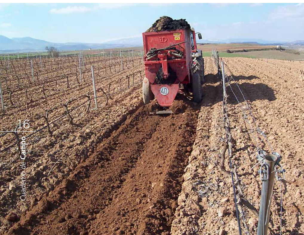
Aplicación de lodos en una viña.

y pueden ir directamente a unos contenedores y de allí se llevan a campo o son almacenados en unos silos con mayor capacidad de volumen para, posteriormente, descargarlos en el camión y transportarlos a la parcela donde se van a aplicar. Una vez en la parcela, se reparten con un esparcidor antes de que transcurran 20-30 días, tiempo máximo que pueden estar acumulados en la finca. Aquí es donde acaba la labor del Consorcio, no sin antes solicitar al agricultor que los incorpore en el suelo mediante un pase de cultivador.