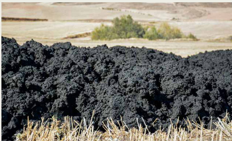
Además de fertilizar, los fangos aportan materia orgánica que favorece la estructura del suelo.