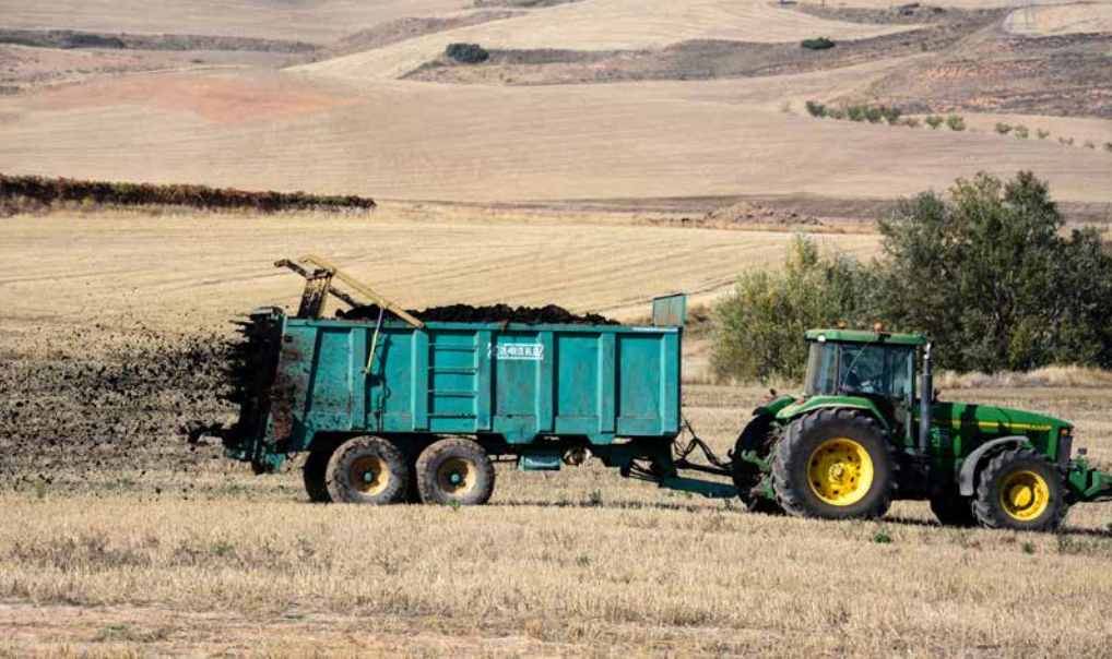
Esparcidor de lodos en una finca de cebada en Rioja Media.