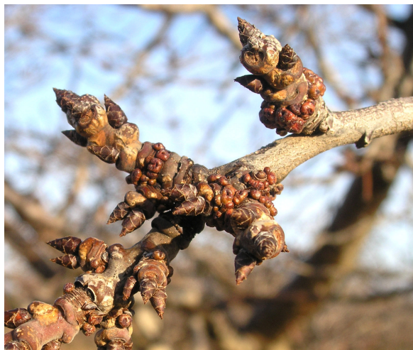
Rama de ciruelo Claudia con agallas provocadas por el ácaro.

Venimos observando durante los últimos años, cuando la densidad de agallas es elevada, un aumento de daños: pérdida de vigor en las yemas, amarilleamiento y clorosis en las hojas, caída de flores y ligera deformación en fruto. En variedades vigorosas los daños tienen menor importancia pero es importante vigilar las plantaciones. Los tratamientos químicos en invierno son ineficaces, pero cuando el nivel de agallas es bajo como es el caso actual, se recomienda eliminar en la poda las ramas afectadas. Los tratamientos químicos se realizarán en primavera cuando se produce la apertura de las agallas y la salida de los ácaros. En próximos boletines se indicará el momento oportuno de tratamiento así como los productos a emplear.