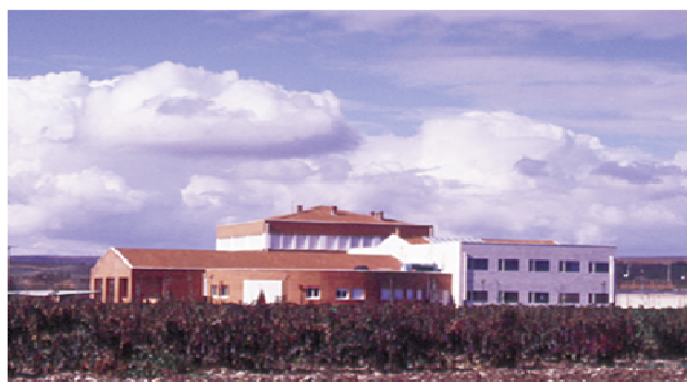
Finca Valdegón, sede del CIDA.

Es muy importante seguir las indicaciones de las casas comerciales que vienen indicadas en el envase de cada producto.