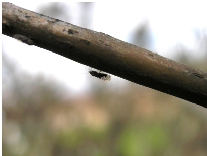
Adulto de Psila

Con el fin de controlar las hembras invernantes antes de que comiencen a realizar la puesta, recomendamos realizar un tratamiento el primer día soleado y con temperaturas superiores a 10°C, utilizando un piretroide autorizado en el cultivo: acrinatrin (Orytis y Rufast-Cheminova) alfa cipermetrin (Dominex-Cheminova; Fastac-Basf); betaciflutrin (Bulldock-Aragro); ciflutrin (Baytroid-Aragro; Blocus-Sarabia); cipermetrin , deltametrin (pr. comunes), esfenvalerato (Sumicidin-Massó; Sumipower-Kenogard; Asana-Kenogard), tau-fluvalinato (Klartan-Aragro; Mavrik-Sipcam). Otra posibilidad de lucha contra esta plaga es dificultar la puesta de las hembras aplicando caolin (Surround-Basf).