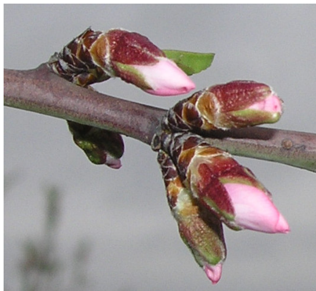
Estado fenológico C/D del almendro.

Debido a que en estos momentos la mayor parte de los huevos se encuentran eclosionados y es fácil eliminar los pulgones nacidos de ellos, ya que todavía no han formado colonias, al producto elegido para luchar contra la "lepra o abolladura" aconsejamos añadir alguno de los siguientes: acetamiprid (Epik-Sipcam; Gacel-Basf); deltametrin (pr. común); imidacloprid (Confidor-Bayer CS; Cohinor-Aragro); lambda cihalotrin ; pirimicarb (pr. comunes); tau fluvalinato (Klartan-Aragro; Mavrit-Sipcam); tiametoxan (Actara-Syngenta).