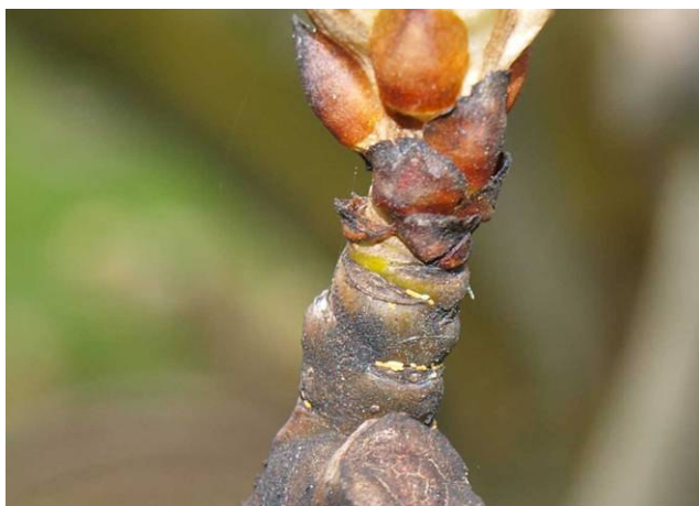
Puesta de psila en peral.

En las parcelas donde no se pudo realizar el tratamiento contra adultos recomendado en el Boletín nº 1 y/o actualmente tienen una alta población invernante, recomendamos tratar ahora contra huevos y adultos utilizando un aceite parafínico + piretrina autorizada en el cultivo .