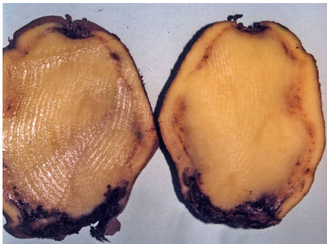
Síntomas de Clavibacter michiganensis en patata.

Los síntomas sobre tubérculos se manifiestan, principalmente, por un oscurecimiento de los ojos y el ombligo, en los que puede formarse un exudado pegajoso, adhiriéndose la tierra a la patata. Adquieren una coloración gris parduzca y al cortarlos transversalmente muestran un cambio de color de la zona vascular. Si la infección está muy desarrollada, al presionar, aparecen unas gotitas pastosas blanquecinas de mucus bacteriano en el anillo vascular.