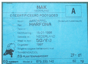
Ejemplo de etiqueta de patata certificada.

Recientemente han aparecido nuevas cepas del VIRUS Y que provocan pequeñas necrosis en los tubérculos. Las variedades con aptitudes para industrialización son las más sensibles. Los tratamientos contra pulgones no permiten en absoluto frenar la transmisión, por lo que se aconseja sembrar patatas certificadas con garantía de que están exentas de virus.