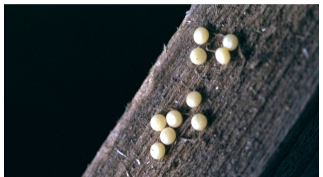
Huevos del taladro de la alcachofa.