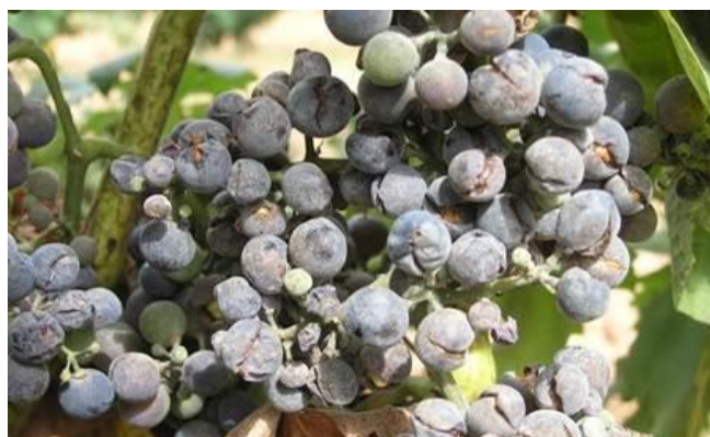
Síntomas de oídio en racimo.

Asimismo, se recomienda valorar la conveniencia de realizar deshojados y desnietados que mejoren las condiciones microclimáticas a nivel de los racimos y faciliten la penetración de los productos fitosanitarios.