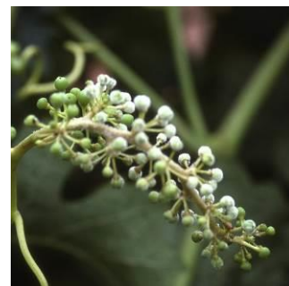
Síntomas de mildiu en racimo.