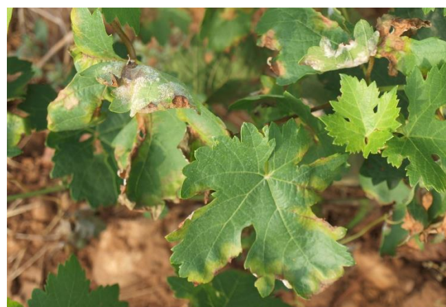
Fuerte ataque de mildiu.