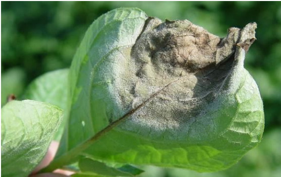
Síntomas de mildiu en hoja de patata.