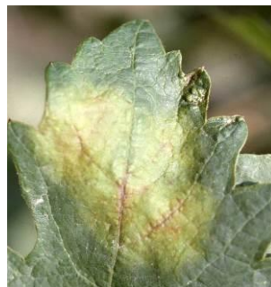
Síntomas de mildiu en hoja.

Se recuerda que la aparición de manchas de mildiu (Premios Mildiu) puede consultarse en la página web www.larioja.org/agricultura/es/agricultura/aparicion-manchas-mildiu-premios-mildiu .