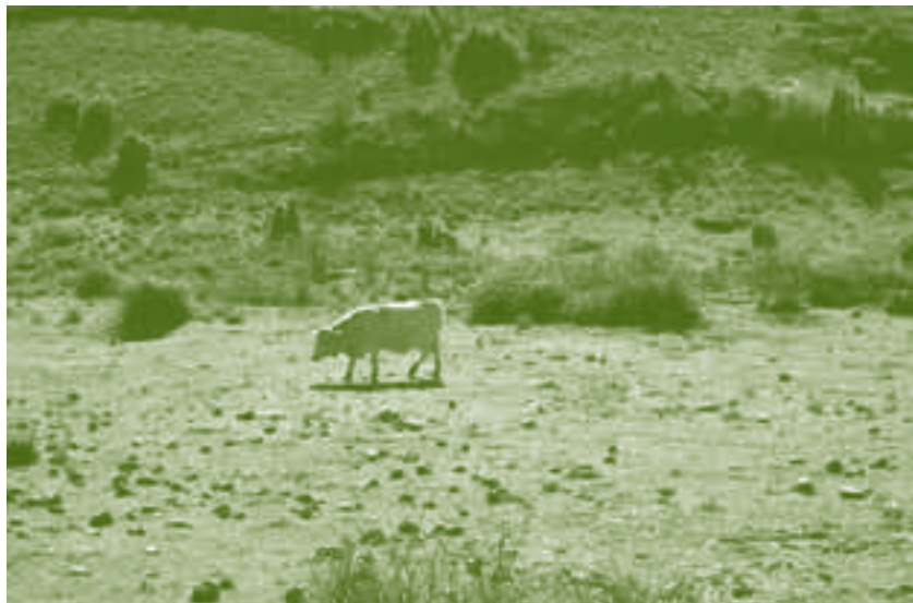
Uno de cada tres euros de la PAC que se gestionan en La Rioja corresponde a ayudas acopladas a la producción.