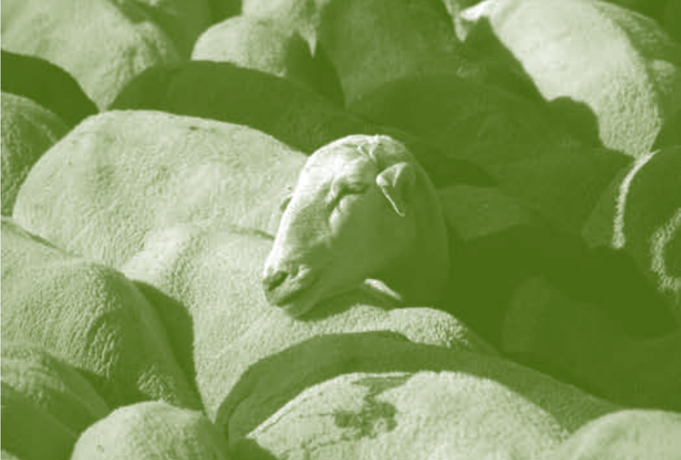
El ovino-caprino y la vaca nodriza mantendrán, de momento, el mismo nivel de acoplamiento que hasta ahora.

El pasado día 20 de noviembre, el Consejo de Ministros de Agricultura de la Unión Europea y la Comisión llegaron a un acuerdo político que recogía los términos de la aplicación de la revisión la Política Agrícola Común (PAC) –el llamado “chequeo médico”– a aplicarse por los Estados miembros entre 2009 y 2012. Los objetivos que se plantea esta revisión de la PAC son: · simplificar el régimen de pago único; · replantearse el apoyo comunitario a las redes de seguridad –intervención de mercados y gestión de crisis–; · consolidar el papel de la agricultura en la lucha contra el cambio climático y la protección del medio ambiente.