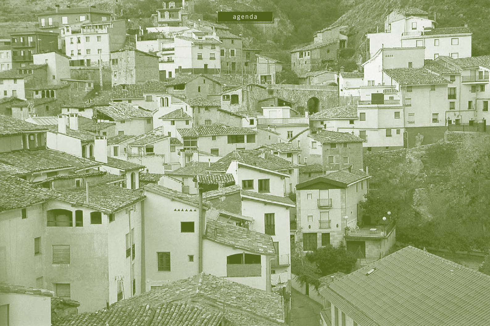
Panorámica de Arnedillo.