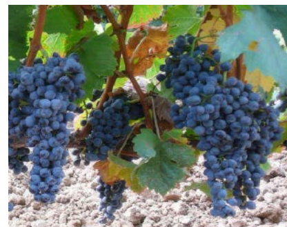
Racimos de la selección TG43 obtenida del cruzamiento entre Graciano y Tempranillo.

Con dichos objetivos se han obtenido cuatro variedades procedentes de cruzamientos de Graciano×Tempranillo. Las