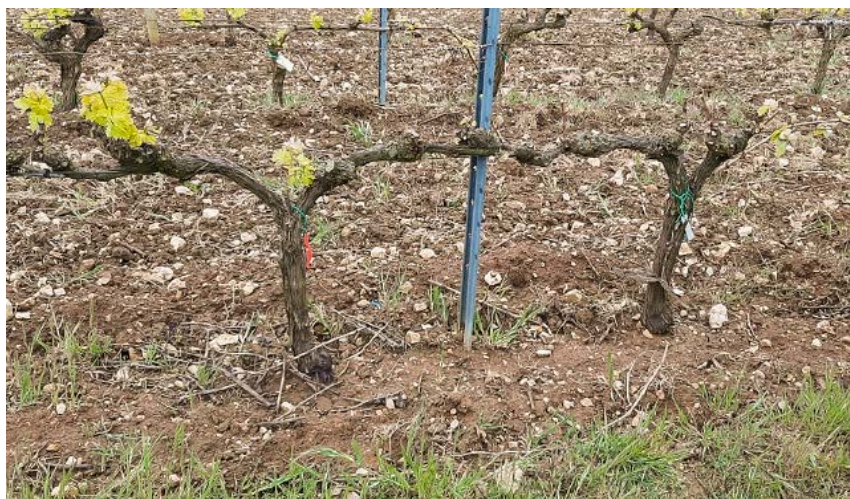
Diferencia entre dos cepas el 29 de abril que han sido podadas en distintos momentos en el ensayo de fechas de poda realizado en Samaniego (Álava) en la campaña 2021.

• Podas muy tardías, llevadas a cabo en un estado de 8 a 12 hojas, han incidido en el grado alcohólico potencial de las uvas, disminuyendo el mismo en más de un 1% vol., si bien hay que tener en cuenta que las reducciones de rendimiento también pueden ser significativas.