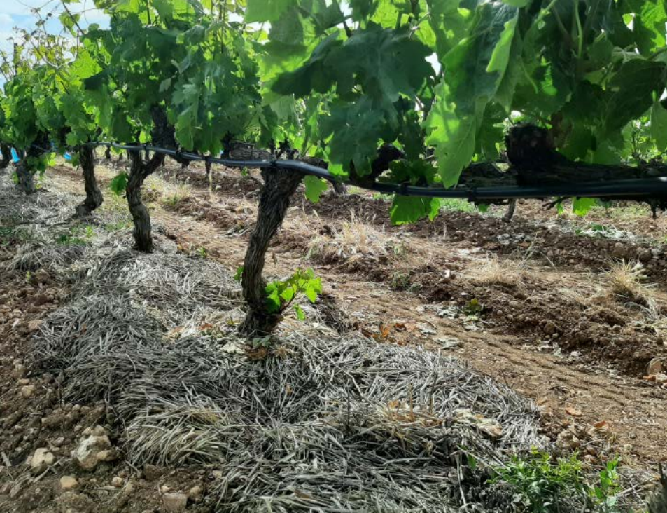
Acolchado con paja, un sistema que permite conservar la humedad del suelo y reducir las necesidades de riego.

un 70% con respecto a suelos labrados. Asimismo, hay que destacar la capacidad de la cubierta para disminuir el efecto invernadero a través de su capacidad como sumidero para fijar CO 2 atmosférico.