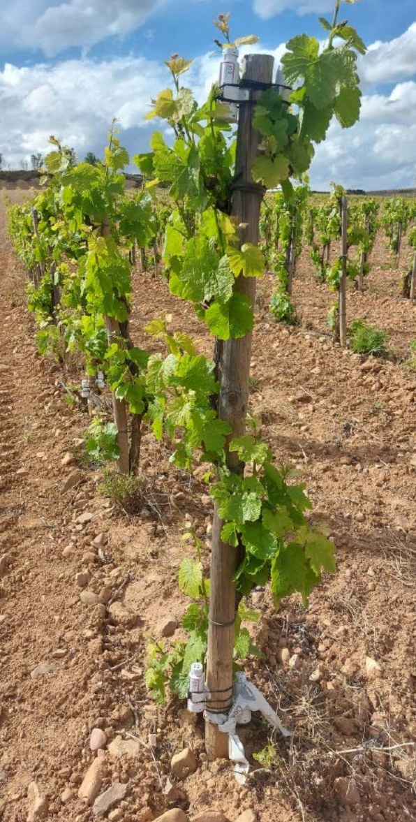
El cordón vertical, al mantener los racimos más cerca del suelo, protege las uvas del exceso de calor.