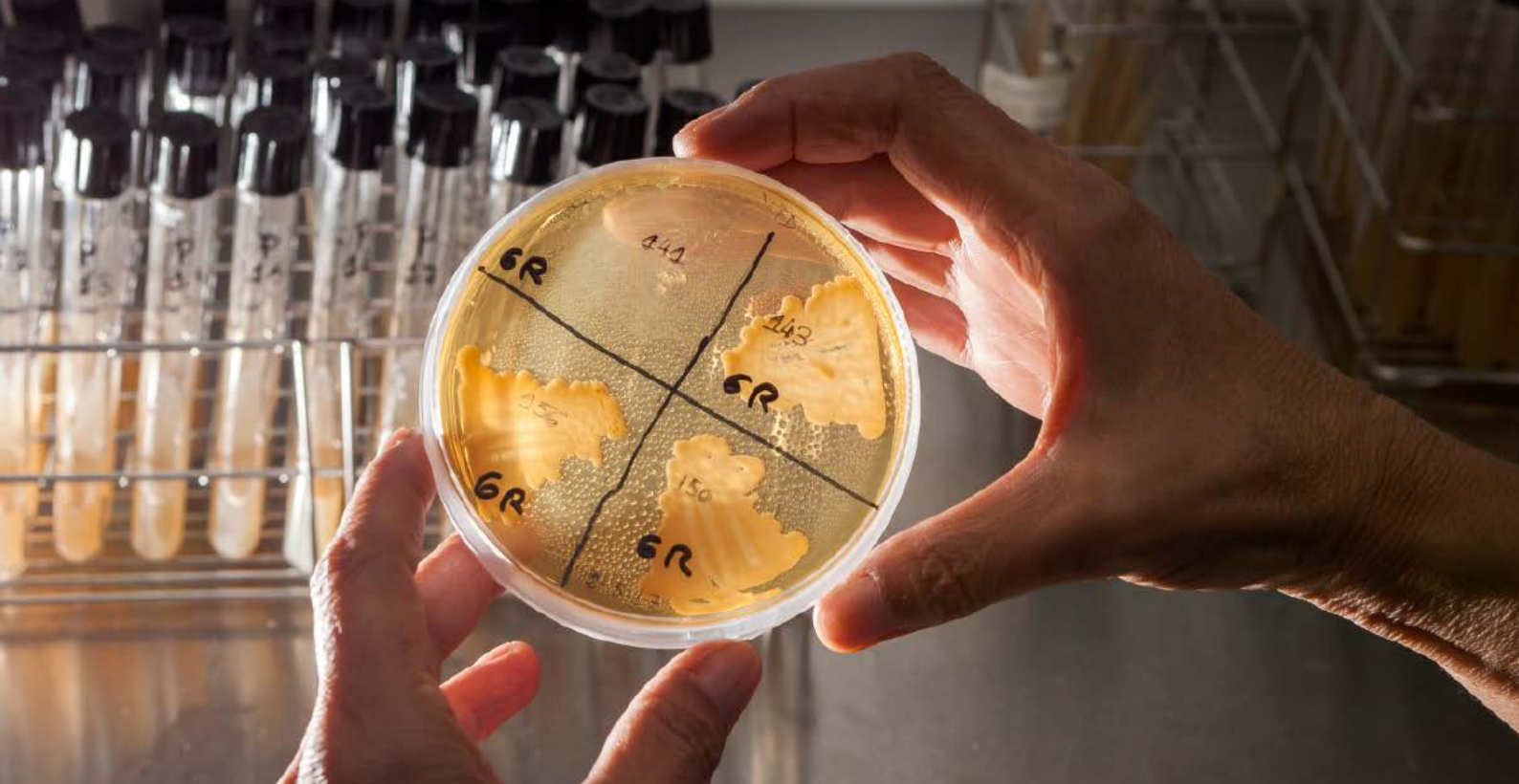
Muestras de levaduras seleccionadas en el ICVV. Rafael Lafuente