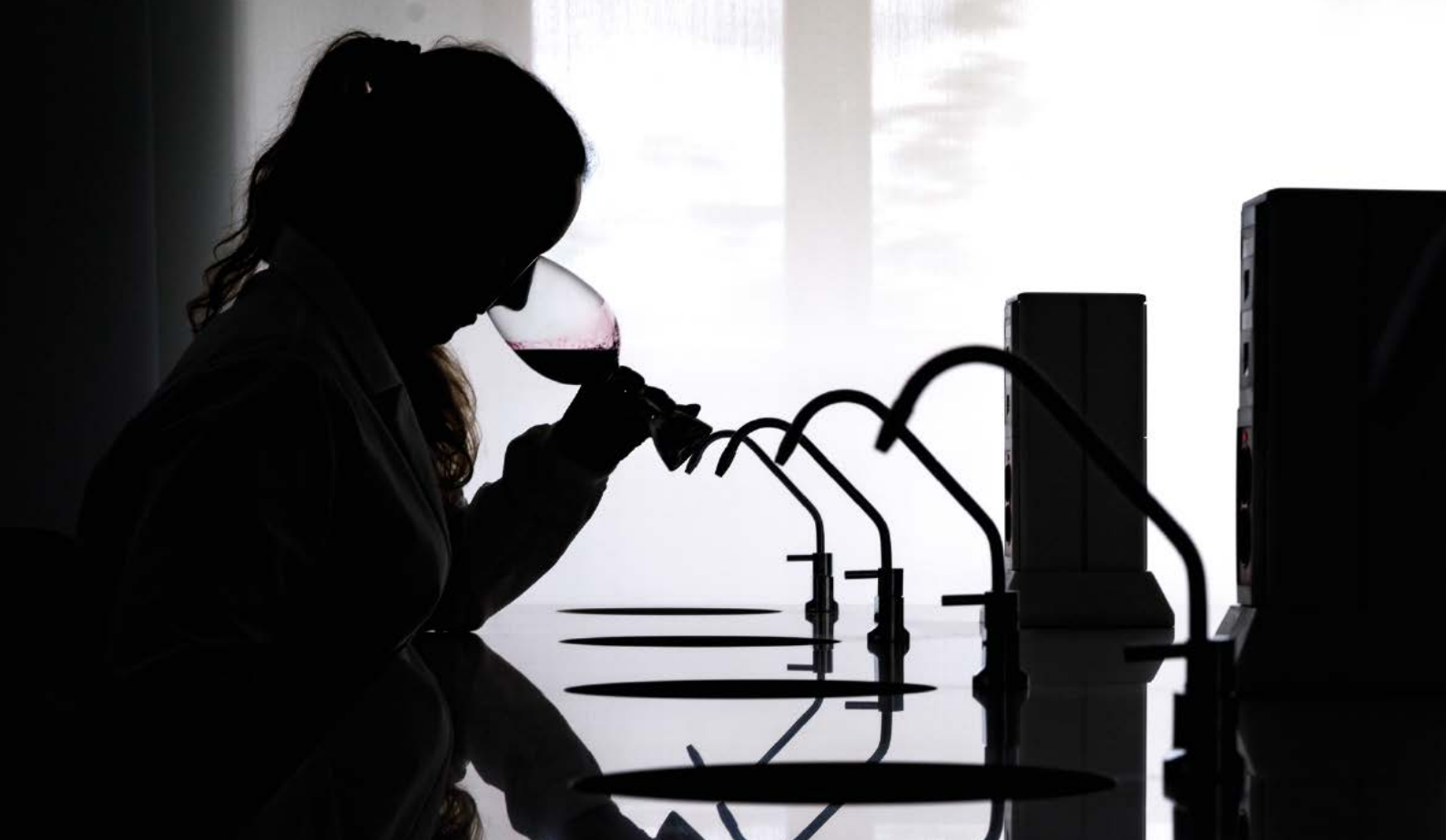
Las altas temperaturas están cambiando el perfil aromático de los vinos.

podría ser una de ellas, ya que, al aplicarse en las plantas, desencadenan mecanismos de defensa que en vitivinicultura pueden tener doble beneficio: reducir el uso de plaguicidas y fungicidas y aumentar la síntesis de compuestos nitrogenados, fenólicos y aromáticos, importantes para la calidad del producto.