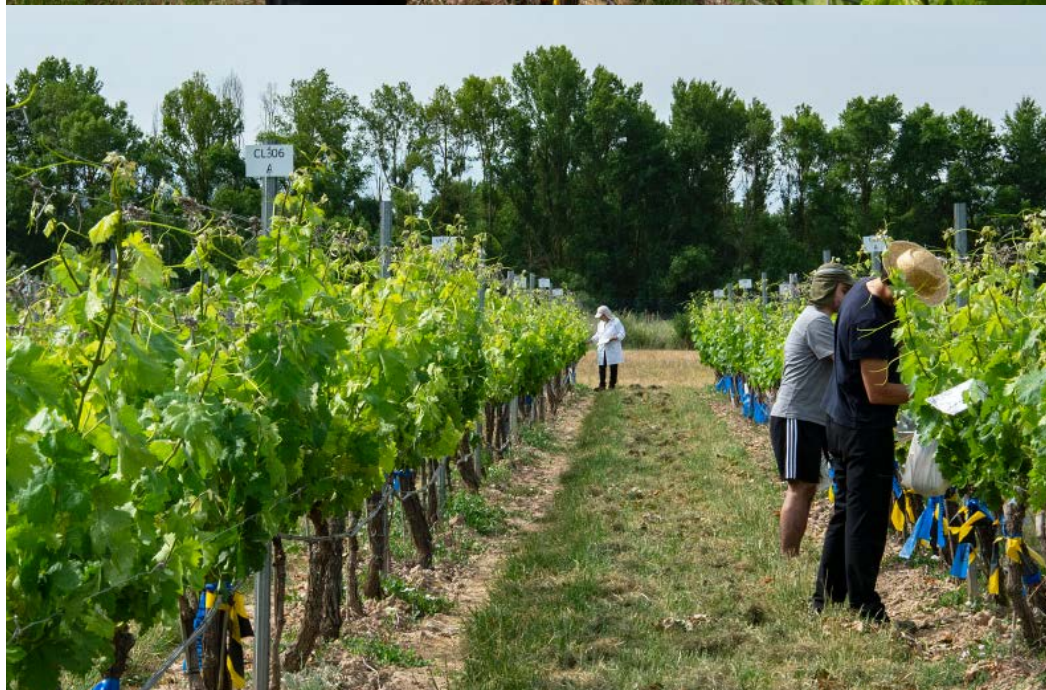
Trabajos de control en la parcela de selección clonal de la variedad Tempranillo Tinto.

adaptación al cambio climático. Hasta el momento, las líneas de actuación se han centrado en la caracterización fenológica, agronómica y enológica de diferentes clones de las variedades tintas Tempranillo Tinto y Graciano, y de las variedades blancas Viura y Garnacha Blanca. Los trabajos desarrollados con los clones de Tempranillo Tinto y Graciano han permitido preseleccionar ocho y cinco de estos clones, respectivamente, encontrándose ya certificados y en fase de multiplicación para que, en un futuro cercano puedan ser ofrecidos a los viveros para su distribución entre el sector vitivinícola.