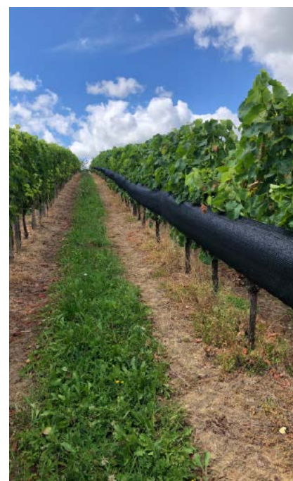
Parcela que combina la cubierta vegetal y el sombreado del racimo.

En las experiencias desarrolladas por el ICVV, desde hace más de dieciocho años, se ha comprobado que el mantenimiento del suelo con cubierta vegetal, como alternativa al laboreo tradicional, constituye una herramienta eficaz para equilibrar viñedos con excesos de producción o vigor, mejorar la biodiversidad del ecosistema vitícola y reducir el uso de herbicidas y fitosanitarios. Además, frente al cambio climático, y al aumento de lluvias torrenciales asociadas al mismo, la cubierta vegetal resulta muy útil para proteger el suelo contra la erosión y la escorrenría, logrando reducirlas en más de