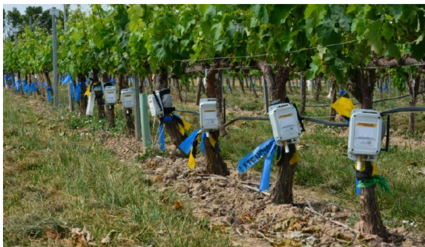
Sensores para el monitoreo en tiempo real de las necesidades hídricas de la planta.

Una de las consecuencias del cambio climático, como se ha comentado anteriormente, es el desequilibrio entre madurez tecnológica y fenológica, con una incidencia negativa en la calidad de la uva. Para abordar este desafío se necesitan prácticas agrícolas innovadoras, eficientes y fáciles de implantar. El uso de elicitores