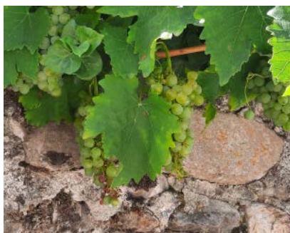
Legiruela, variedad de uva blanca localizada en el valle del Oja, interesante por su maduración temprana para cultivar en altura.

En La Rioja, también se han detectado poblaciones de vid silvestre (antecesor de la vid cultivada) en los valles de los ríos Najerilla, Iregua y Oja. Estas vides pueden resultar de gran interés porque pueden aportar tolerancias a estreses bióticos (como enfermedades de madera) y abióticos (como salinidad). Muestras de las plantas recolectadas se conservan en el banco de germoplasma del ICVV y se analizan genéticamente.