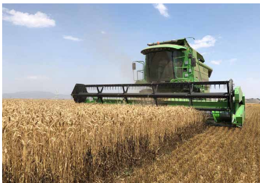
Cosechadora con monitor de rendimientos empleado en el ensayo.