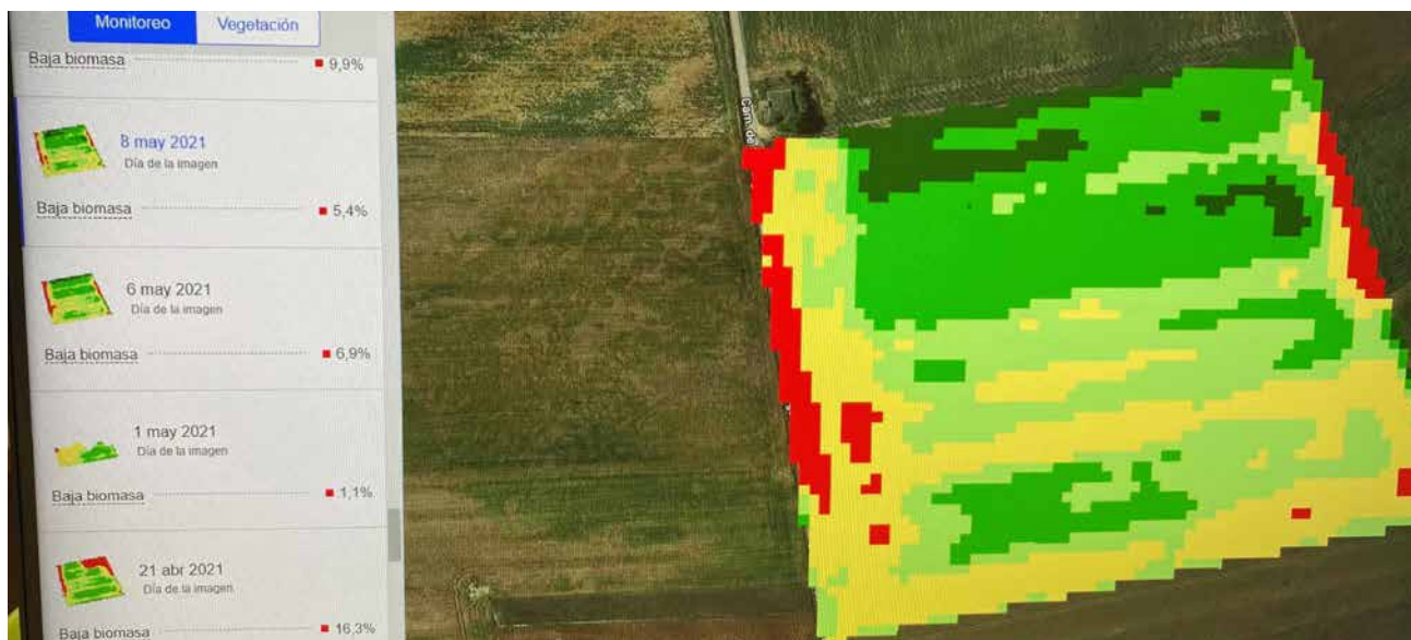
Ejemplo de monitoreo mediante satélite con la aplicación FieldView™.

Potenciar el trigo riojano de calidad de un alto valor añadido con el que el agricultor consiga una mayor rentabilidad para sus cosechas ha sido uno de los principales objetivos del proyecto TRICUM Rioja.