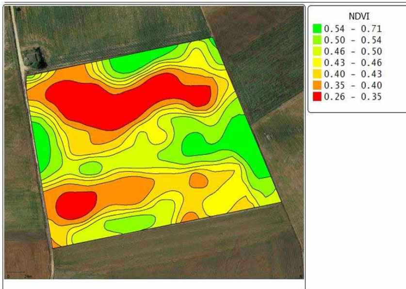
Mapa de Índice de Vegetación (NDVI) obtenido en abril de 2022.