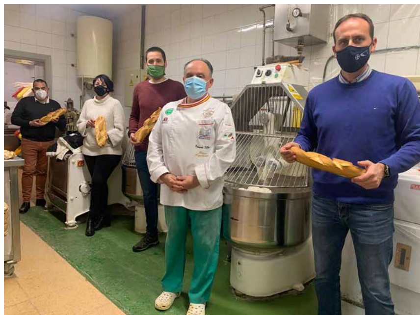
El equipo del proyecto muestra el pan elaborado con las harinas obtenidas.

Los datos de la última campaña 2021-2022 están pendiente de estudio y se incorporarán una vez realizada la evaluación de resultados a la web del proyecto.