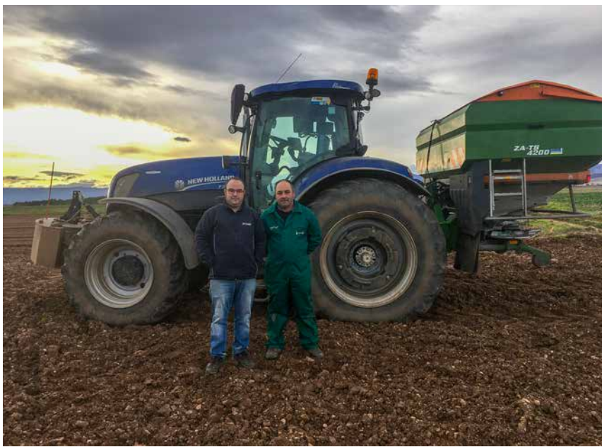
En las imágenes se muestra el monitor Isobus (arriba) utilizado para la gestión de la abonadora.