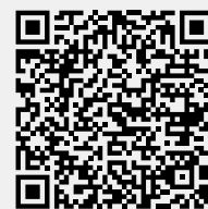
Consulta las ayudas a la dosificación variable

quiridos, así como el importe de la prima, se puede acceder a la información a través del código QR.