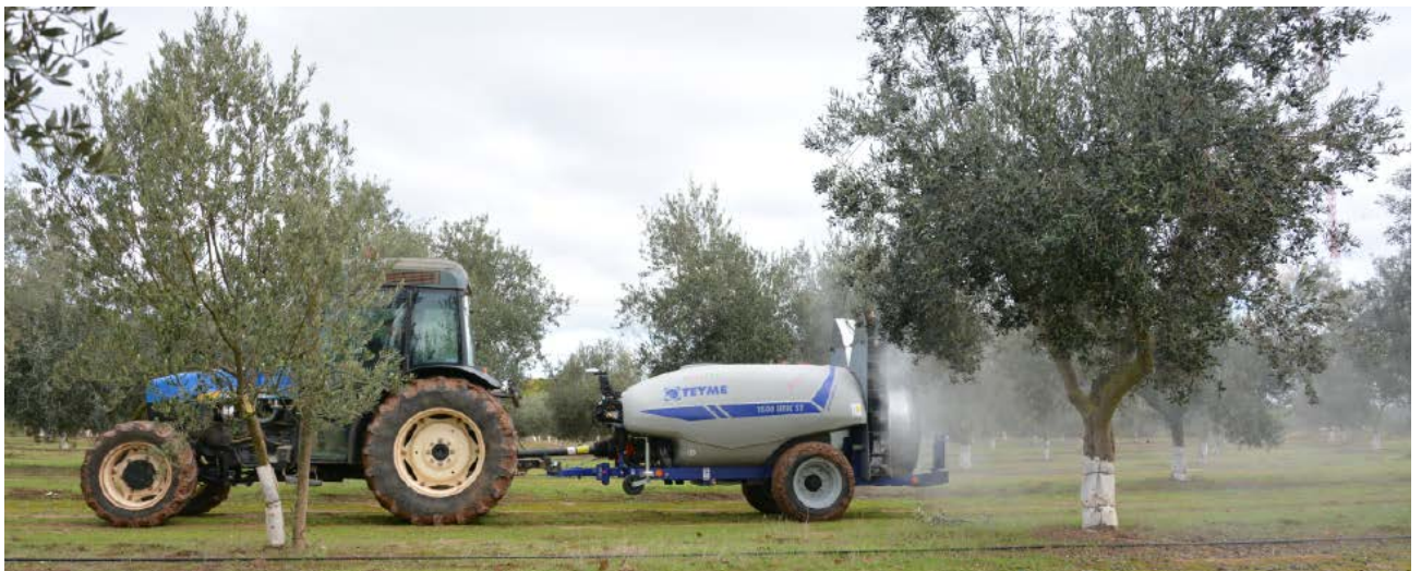
Aplicación de fitosanitarios en olivo con equipo de precisión.

En una línea paralela a lo explicado, se están desarrollando nuevas tecnologías para aplicaciones fitosanitarias utilizando sensores a tiempo real ( on-the-go ). Estos sensores sofisticados se instalan en la parte delantera de los tractores o bien en los propios equipos de tratamientos y nos permiten medir uno o diversos parámetros para decidir la dosis a aplicar en el mismo momento en que el equipo