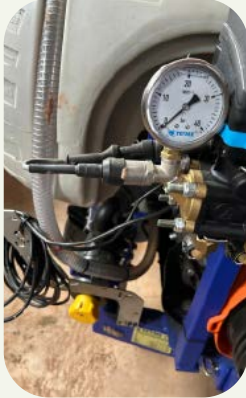
4. Calibración de equipos