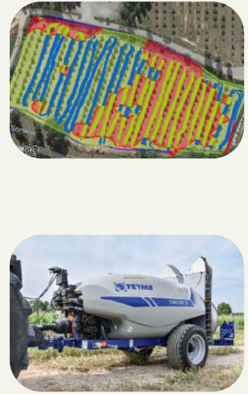
3. Selección de tecnología

permiten su adaptación a la cantidad de vegetación existente en la parcela, por ejemplo, considerando el área de pared foliar presente en la plantación en el momento de realizar el tratamiento (Leaf Wall Area).