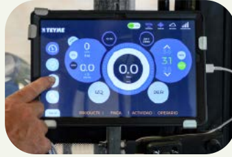
5. Monitorización y ajustes