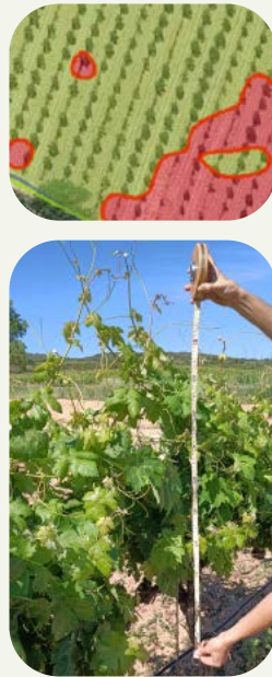
2. Establecimiento de dosis