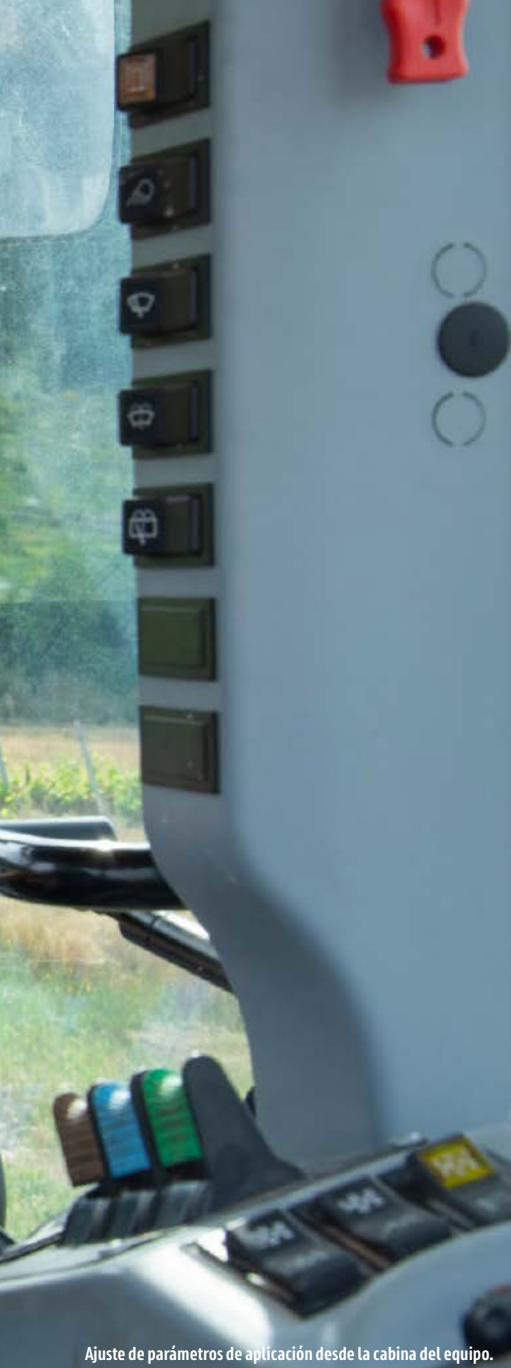
Ajuste de parámetros de aplicación desde la cabina del equipo.

El sector agrícola atraviesa una coyuntura complicada, en la que se debe aprovechar la disponibilidad de las nuevas tecnologías, que posibilitan alternativas al manejo tradicional y pueden enfocar a las explotaciones hacia modelos más eficientes y sostenibles, haciendo un menor uso de productos fitosanitarios para obtener los mismos rendimientos productivos. El tamaño de las parcelas, la adecuación de los equipos y el precio de la instalación, junto con la situación económica que atraviesa el sector, propician que muchos agricultores sean reacios a la modernización. Sin embargo, a lo largo de este artículo se muestra cómo algunas tecnologías y, en concreto, la dosificación variable de productos fitosanitarios, hacen posible optimizar económica y medioambientalmente la gestión de las explotaciones. Pero, ¿en qué consiste esta técnica? y ¿qué se necesita realmente