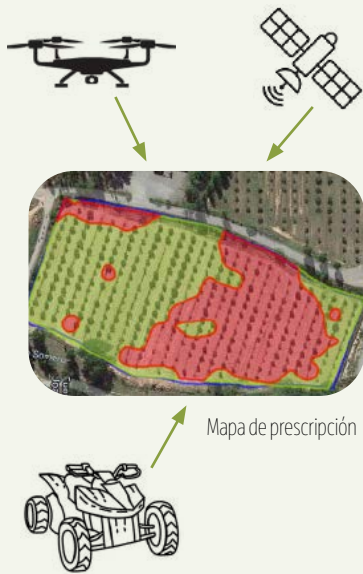
1. Recopilación de datos y mapeo de suelo