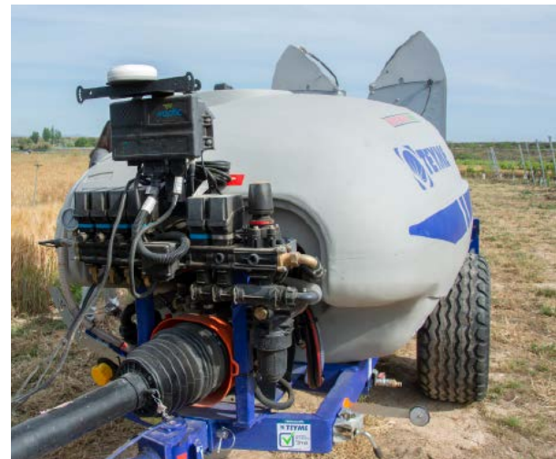
Dispositivos de tecnología de dosificación variable: GPS, electroválvulas, etc.

Desde las administraciones públicas, con la finalidad de contribuir a un uso sostenible de los productos fitosanitarios que permita alcanzar el objetivo de reducción del 50% de los mismos para 2030, se apoya este tipo de prácticas en el Plan Estratégico de la Política Agraria Común 2023-2027. En concreto, en La Rioja se ha establecido una línea de ayuda denominada gestión de insumos agrícolas mediante tecnologías de dosificación variable en productos fitosanitarios y fertilizantes, que se puede solicitar a través de la solicitud única de la PAC. Esta línea se integra dentro de los compromisos de cultivos sostenibles de las intervenciones territoriales de Desarrollo Rural del PEPAC. Si se desea conocer las condiciones de admisibilidad y compromisos ad-