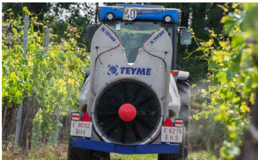
Cierre automático de boquillas con sensores ultrasónicos.

Esta etapa es una fase crítica, ya que la primera decisión es cuántos espacios se van a diferenciar y de qué forma se va a gestionar cada una de las zonas establecidas. Se deberán definir los volúmenes de caldo de aplicación y las dosis del producto a utilizar en función de las características obtenidas del análisis de la información, así como de los objetivos de manejo perseguidos. A este respecto, señalar que en cultivos leñosos comienzan a registrarse productos fitosanitarios con indicaciones de dosificación que