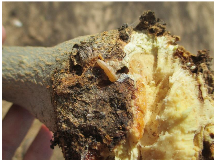
Larva de Euzophera pinguis

Para controlar dichos daños los únicos productos autorizados actualmente son el spinetoram (Delegate-Corteva) y el lambda cihalotrin (pr. común) aunque los tratamientos realizados contra otras plagas como prays o barrenillo negro también pueden ser efectivos. En estas aplicaciones es necesario asegurar un buen mojado de tronco y ramas principales.