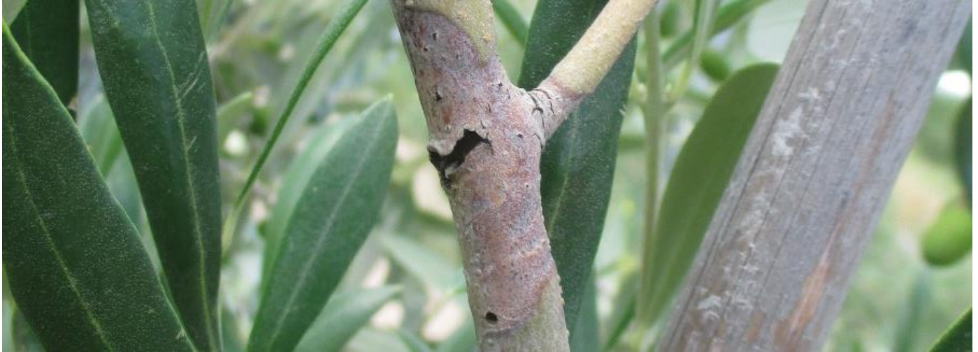
Galería con mancha de color cobrizo característica.

Es una plaga de escasa importancia en La Rioja y con mayor presencia en olivares abandonados, que en los últimos años ha visto incrementada su actividad sobre todo en plantaciones antiguas de secano, por las que tiene preferencia.