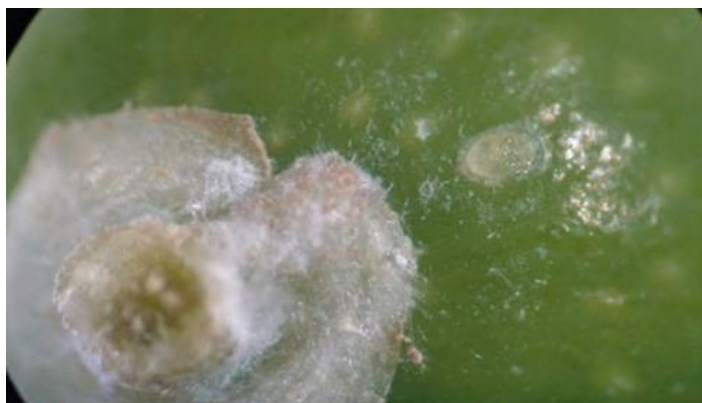
Detalle de huevo de polilla sobre fruto.

Para elegir el momento adecuado para realizar el tratamiento, tradicionalmente se ha usado la fecha en que el fruto tiene el tamaño de un guisante. Sin embargo, resulta más preciso determinarlo mediante el conteo de huevos eclosionados o el empleo de las curvas de vuelo, seleccionando el momento en función de la persistencia y número de aplicaciones permitidas por campaña. Actualmente, el cuajado está prácticamente generalizado, a pesar de que el tamaño de la oliva aún es muy reducido. Sin embargo, ya ha comenzado el vuelo de adultos en prácticamente todos los puntos de monitoreo, lo que supone el inicio de las puestas de huevos. Puede consultarse la evolución de esta plaga en la página web del Gobierno de La Rioja www.larioja.org/agricultura , dentro del apartado de la Sección de Protección de Cultivos. Estos datos se actualizan semanalmente.