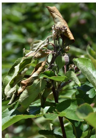
Síntomas en manzano.