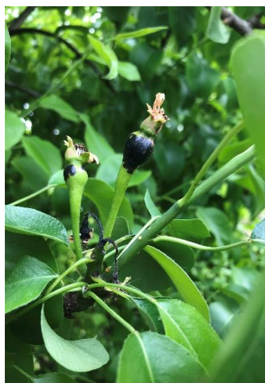
Síntomas en fruto recién cuajado en peral.