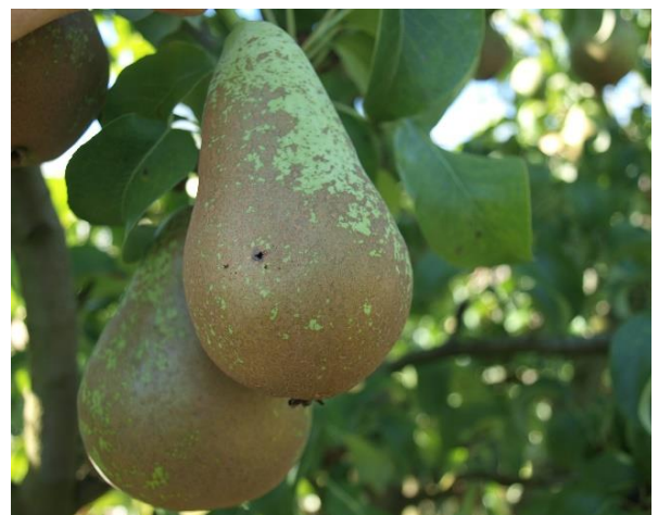
Daño de carpocapsa en peral.