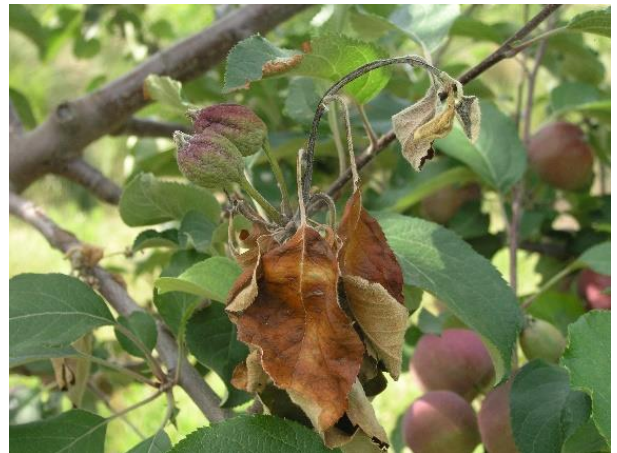
Síntomas de fuego bacteriano en manzano.

Los productos Aureobasidium pullulans (Blossom Protect - Andermatt) y Laminarin (Vacciplant Max) solo pueden usarse hasta floración contra fuego bacteriano.