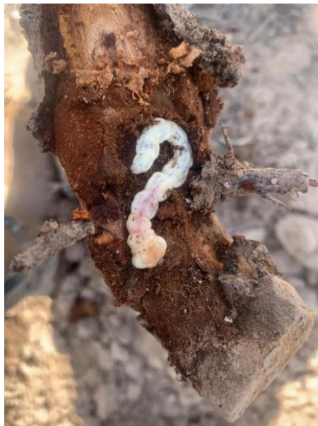
Daños causados por gusano cabezudo en tronco de ciruelo.