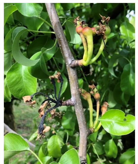
Síntomas en peral.

Los síntomas iniciales de fuego bacteriano en floración pueden confundirse con otras bacterias como pseudomonas, pero una analítica nos confirmará la diferencia. Pseudomonas no presenta exudados como puede verse en la fotografía y los síntomas suelen limitarse a la flor y no se extienden a la rama.