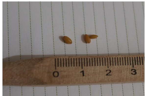
Pupa de Rhagoletis.

También se puede recurrir al trampeo masivo para su control empleándose deltametrin ( Decis Trap Cerasi - Bayer; Flypack Cerasi - Sedq).