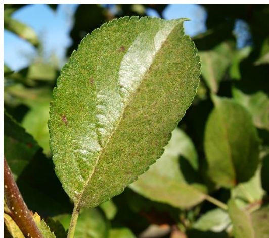
Pateadura decolorada en hoja de manzano causada por araña.

Será necesario ajustar los abonados nitrogenados a las necesidades del cultivo, ya que crecimientos vegetativos elevados favorecen la aparición de la araña.