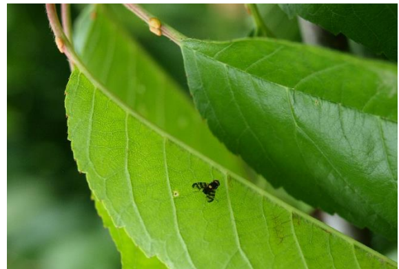
Adulto de Rhagoletis.

Todavía no se han detectado presencia de adultos, pero se recomienda que se vigilen especialmente aquellas parcelas donde no se cosechó toda la fruta, además de las parcelas próximas a otras abandonadas o no tratadas. El umbral en esta plaga es muy bajo, de una captura trampa y día, debido al potencial de daños que posee y a la proximidad de la recolección, que dificulta su tratamiento y control. Además, sus penetraciones suponen una vía de entrada a enfermedades que generan podredumbres.