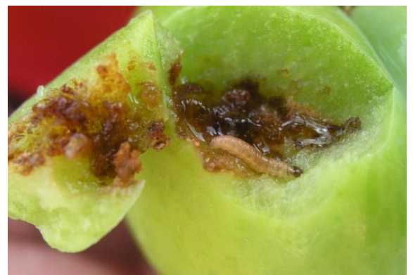
Larva de Cydia funebrana .

No es conveniente abusar de los piretroides ya que pueden provocar un incremento de araña roja, por ello se aplicarán solo cuando debido al plazo de seguridad no se pueda usar otro insecticida.