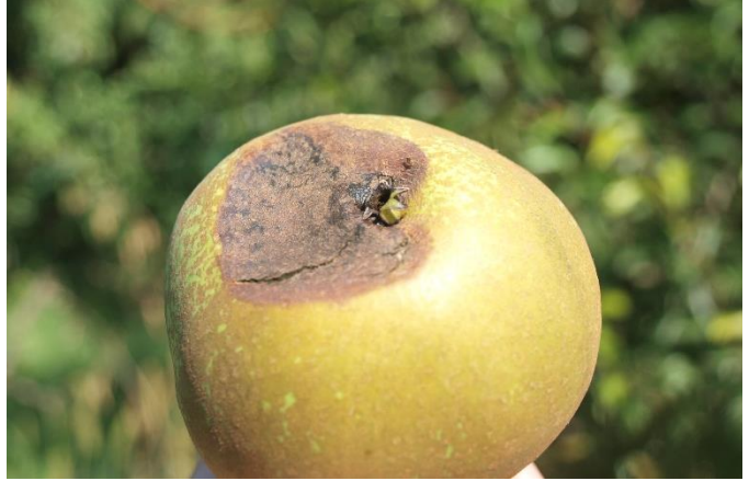
Síntomas de filoxera en fruto.

El principal problema de esta plaga que afecta al peral es que solo se observan sus daños cuando los frutos están próximos a recolección. Las ninfas provocan picaduras en la zona calicina del fruto, en el punto de contacto entre dos frutos y raramente en la base del pedúnculo, lo que da lugar a podredumbres secas, ya que se favorece la penetración de los hongos que en el periodo de conservación generan graves problemas. La lucha química va dirigida a controlar las poblaciones de ninfas que evolucionan a partir de los primeros días de mayo. En caso de haber sufrido daños en años precedentes realizar un tratamiento a mediados de mayo y el siguiente unos 15-30 días después con alguna de las siguientes materias activas: acetamiprid (pr.común).