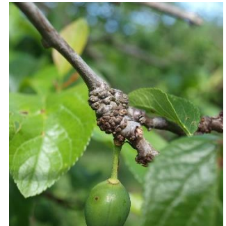
Síntomas de ácaros de las yemas.

Por ello, en caso de tener árboles con abundantes agallas, se recomienda tratar con azufre mojable* (pr. común) de mediados a finales de mayo. Para cubrir toda la salida, realizar al menos 2 aplicaciones espaciadas 10 días.