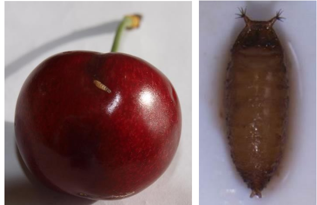
Larva de Drosophila y pupa.

Además, puede emplearse el método de captura y muerte mediante deltametrin 0,015 % RB (Decis Trap Suzukii - Bayer).