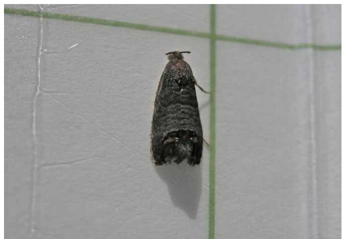
Adulto de Cydia pomonella .