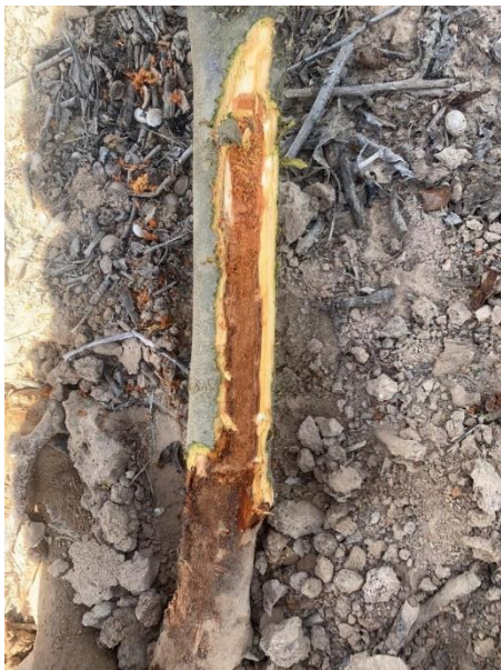
Daños de la larva de gusano cabezudo en raíz de ciruelo. Autor Santiago Ezquerro Herreros.

En parcelas que presentaron daños en años precedentes se recomienda realizar tratamientos en mayo y junio para evitar la puesta con acetamiprid 20% SP y SG (pr. común) o acetamiprid 20 % SL (Carnadine - Nufarm) en frutales de hueso, y acetamiprid (Gazel Plus - BASF) solo en almendro.