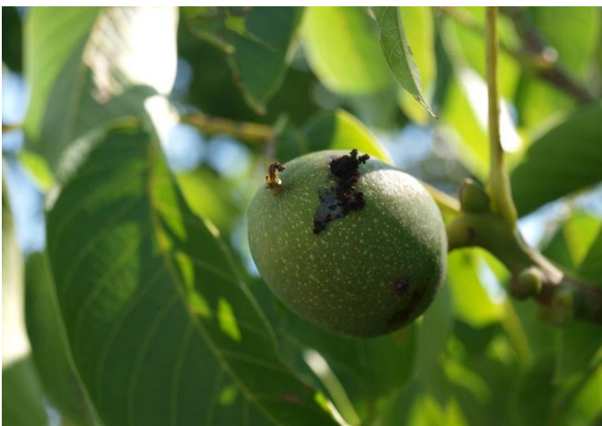
Daños de carpocapsa en nuez.

En plantaciones regulares de cierta superficie, también se puede emplear la técnica de confusión sexual para controlar esta plaga, debiendo estar ya colocados los difusores.