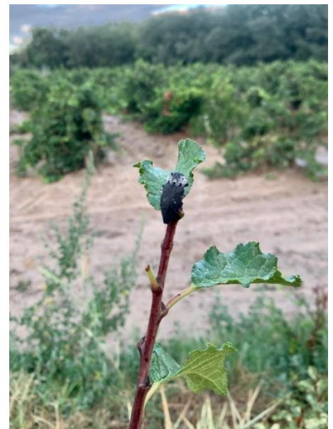
Hojas comidas en la zona del peciolo por el adulto.