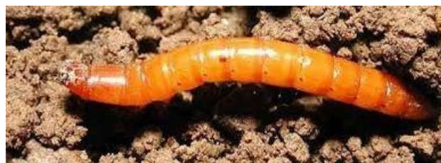
Gusano de alambre o alfilerillo.

Los gusanos del suelo (grises, blancos y de alambre o alfilerillo) producen daños sobre los tubérculos al alimentarse de ellos para completar su ciclo biológico. Para controlarlos se pueden utilizar al sembrar insecticidas en forma de granulado aplicados en la línea de cultivo, como cipermetrina MG (Columbo-Corteva), lambda cihalotrin GR (pr. común), teflutrin GR (Cárabo – Faesal; Turin 0,5 – Brandt), spinosad* 0,1% GR (Insecticida suelo GR-SBM) y spinosad* 0,4% GR (Spintor GR-SBM). También se puede utilizar Beauveria bassiana * OD (Naturalis-Biogard), realizando un tratamiento sobre la patata de siembra antes de enterrarla y antes del aporcado.