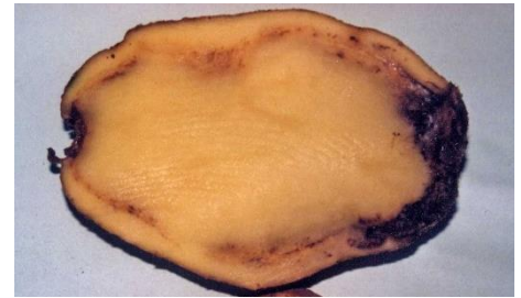
Síntomas de Clavibacter michiganensis .

Si la infección está muy desarrollada, al presionar, aparecen unas gotitas pastosas blanquecinas de mucus bacteriano en el anillo vascular.