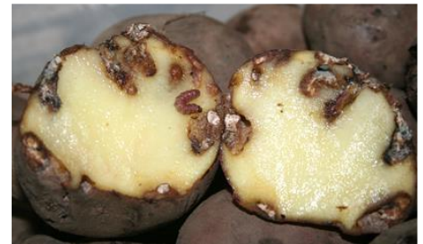
Tubérculo dañado por Tecia solanivora .

Los comerciantes o puntos de venta de patata de siembra recabarán de los compradores la siguiente información: nombre y dirección, cantidad y fecha de adquisición, y la conservarán durante, al menos, un año.