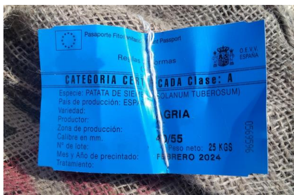
Etiqueta oficial azul de patata de siembra.

Si antes de sembrar, observa en su patata de siembra algún síntoma de Clavibacter , Ralstonia , Epitrix y/o Tecia , póngase en contacto con la Sección de Protección de Cultivos.