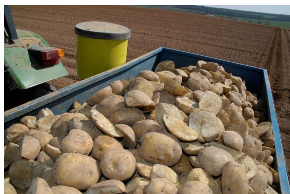
Tubérculos para siembra.

Previamente a la realización de la siembra es conveniente limpiar y desinfectar el equipo que se emplea para la misma.