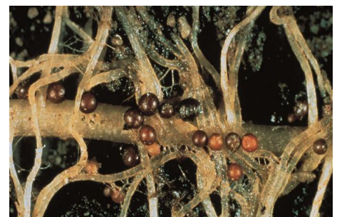
Quistes de Globodera producidos en el sistema radicular.

Las hembras de estos nematodos se transforman en quistes adheridos a las raíces para soportar condiciones ambientales adversas y proteger a la descendencia. Esto provoca un menor crecimiento y actividad de las raíces, provocando una menor absorción de agua y nutrientes. En consecuencia, se produce un menor número de tubérculos, de tamaño más pequeño que los producidos en parcelas no afectadas.