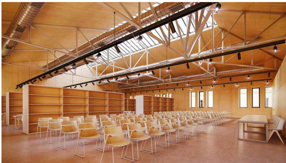
El edificio 2 albergará el archivo histórico de la Estación Enológica y una zona polivalente para distintas actividades.