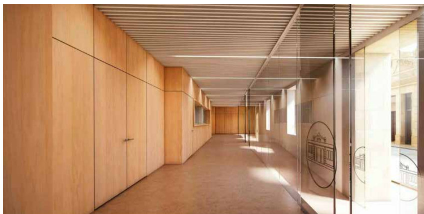
Zona de accesos al edificio principal.

nética, en la zona norte, ambos dotados con diferentes salas auxiliares (recepción de muestras, preparación de reactivos, almacén...) y despachos.