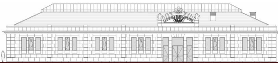
Alzado del edificio 2, situado a la derecha del patio central.