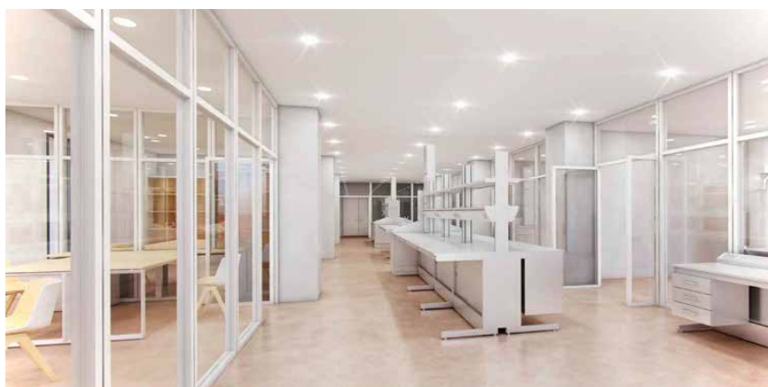
Recreación de los laboratorios que ocuparán la segunda planta del edificio principal.

En la primera planta, con dos accesos centrales desde la planta baja y una zona diáfana entre ambos extremos del edificio, previsto para futuras ampliaciones, se situarán los laboratorios de Microbiología, en el lado sur, y el de Resonancia Mag-