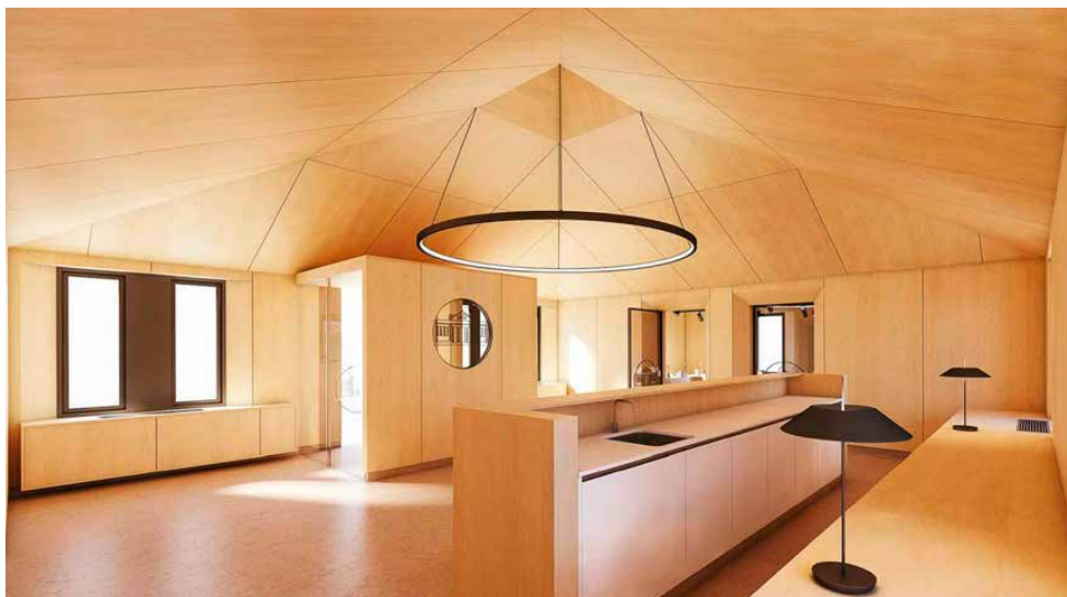
Recreación del espacio de entrada al edificio 3.

tualmente un laboratorio ubicado en el edificio principal para las prácticas de los alumnos que cursan el ciclo superior de Vitivinicultura en el IES Ciudad de Haro.