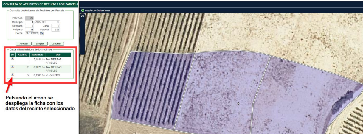
Pulsando el icono se despliega la ficha con los datos del recinto seleccionado

Una vez introducida la referencia Sigpac de la parcela y la fecha en la que queremos consultar, la aplicación devuelve la información gráfica de la parcela en la fecha consultada y enumera los recintos que la componen.