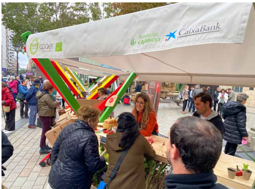
El eco mercado con productores locales se celebra todos los sábados en Logroño, en la plaza de Escuelas Trevijano. G. Criteria

A.4.2. Flexibilizar la normativa para favorecer pequeñas iniciativas de elaboración y transformación ligadas a la producción propia