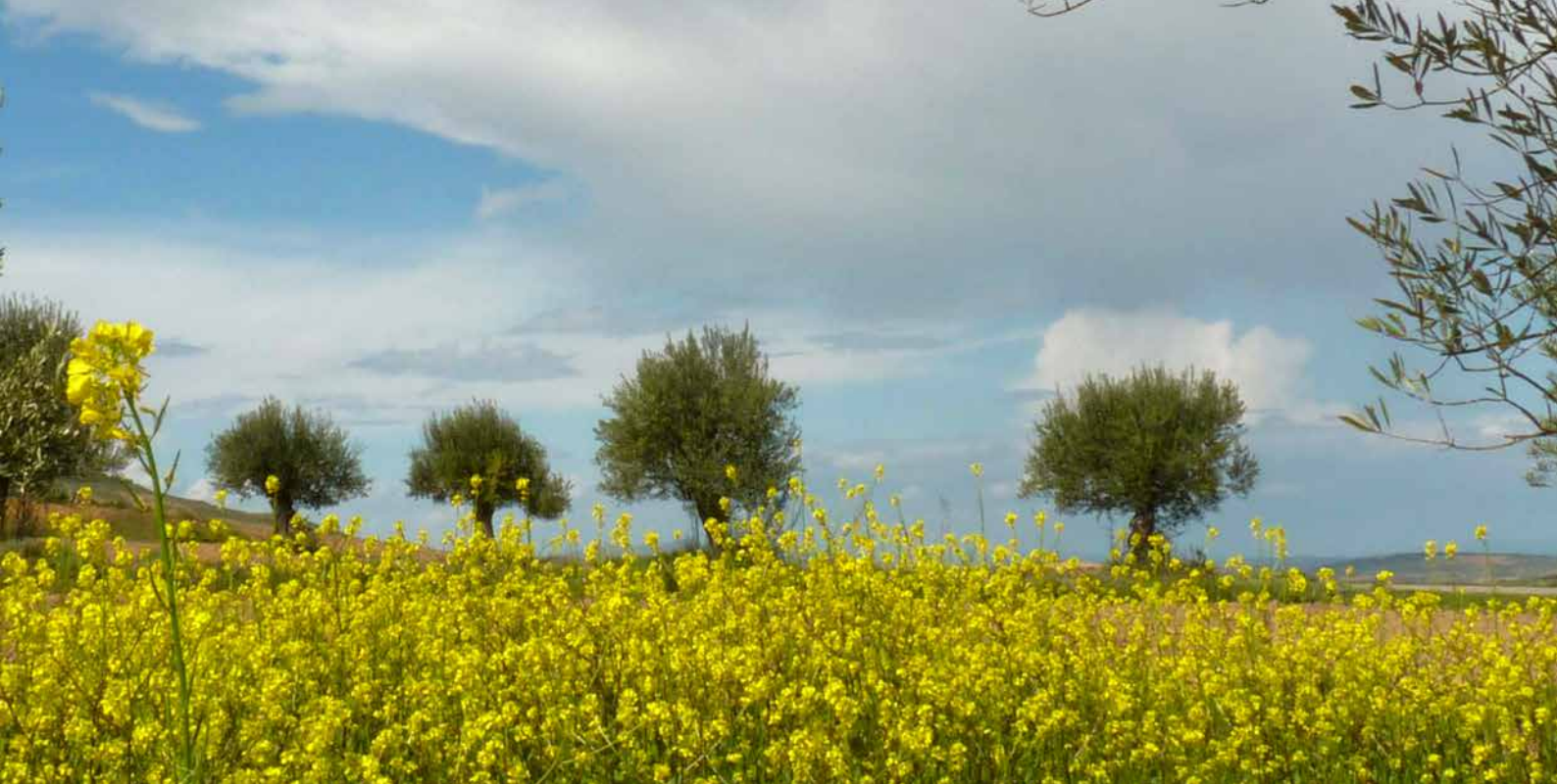
El 13% del olivar riojano se cultiva en ecológico y hay once almazaras certificadas. S. Sarasibar

El Pacto Verde europeo pretende conseguir una Europa climáticamente neutra en 2050, con el sector agrario como una de sus puntas de lanza. La estrategia “De la granja a la mesa” persigue que el 25% de las tierras agrícolas de la Unión Europea estén en producción ecológica para el año 2030. Este aumento de la superficie agraria ecológica es un objetivo en el que se está trabajando solidariamente tanto en el ámbito europeo como nacional y regional.