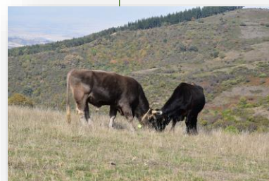
Ganadería ecológica II. Gestión de pastos